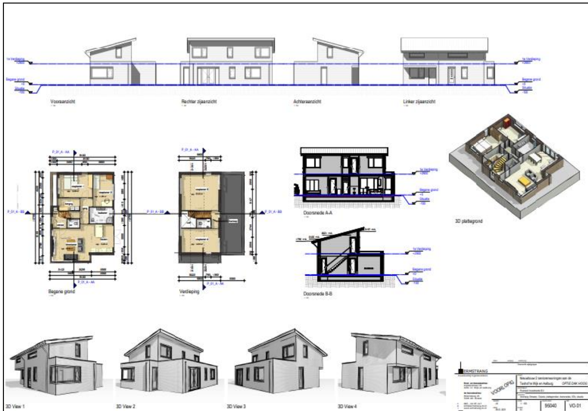
Figuur 7. Voorlopige situatietekening bouwplan seniorenwoning hoog dak.

De initiatiefnemer is voornemens om twee nieuwbouwwoningen (seniorenwoningen) te realiseren op de onderzoekslocatie. In figuur 7 en 8 zijn de voorlopige situatietekeningen van de bouwplannen weergegeven.