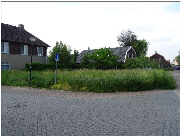
Figuur 3. Perceel aan de noordzijde van de Taxhof.