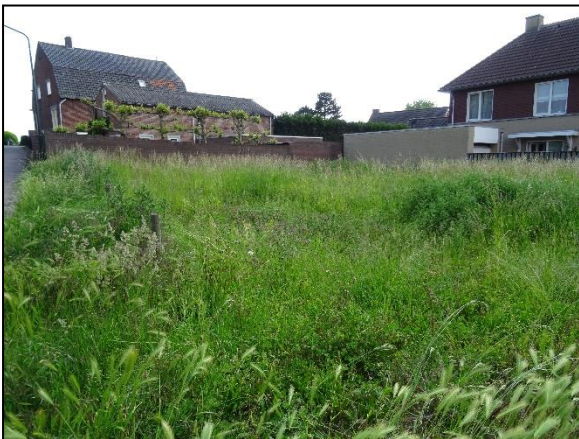
Figuur 5. Perceel aan de zuidzijde van de Taxhof