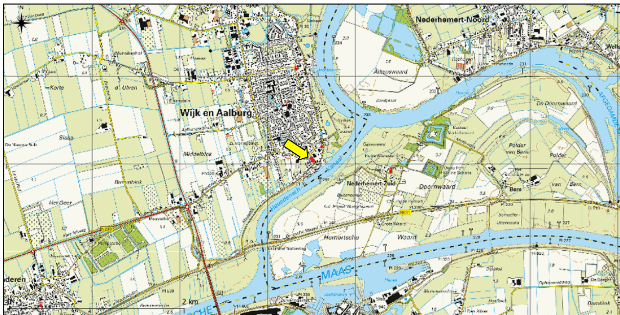
Figuur 1. Topografische ligging van de onderzoekslocatie (gele pijl).

De onderzoekslocatie ( \pm 640 \text{ m}^2 ) ligt aan weerszijden van de Taxhof (ong.), in de kern van Wijk en Aalburg (figuur 1). Volgens de topografische kaart van Nederland zijn de coördinaten van het midden van de onderzoekslocatie X = 137.511 , Y = 418.039 .