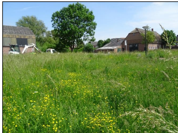
Figuur 4. Perceel aan de noordzijde van de Taxhof.