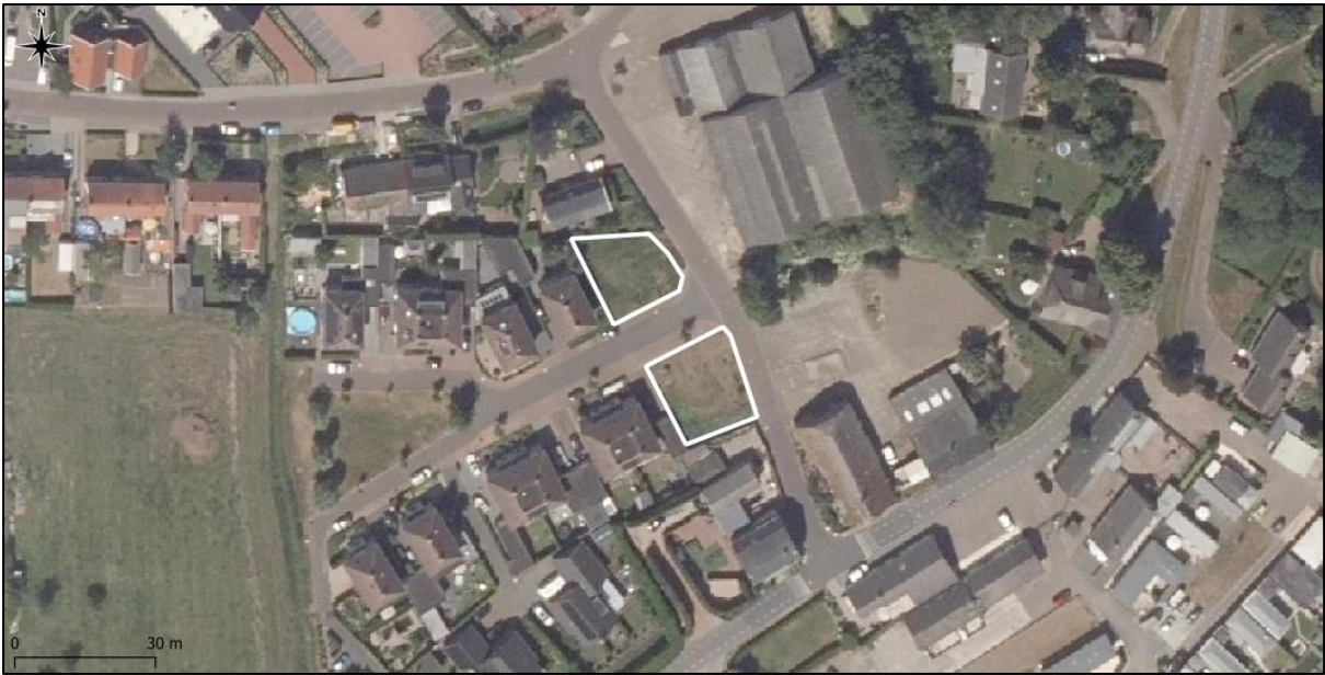
Figuur 2. Luchtfoto onderzoekslocatie (wit omlijnd) en de directe omgeving.