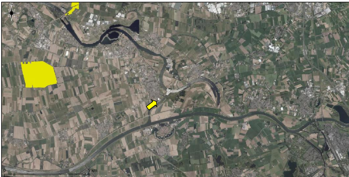
Figuur 9. Ligging onderzoekslocatie (gele pijl) ten opzichte van Natura 2000-gebieden (gele vlakken).

De onderzoekslocatie is niet gelegen binnen de grenzen, of in de directe nabijheid van een gebied dat aangewezen is als Natura 2000. Het meest nabijgelegen Natura 2000-gebied, Loevestein, Pompveld & Kornsche Boezem, bevindt zich op circa 6,1 kilometer afstand ten westen van de onderzoekslocatie (figuur 9).