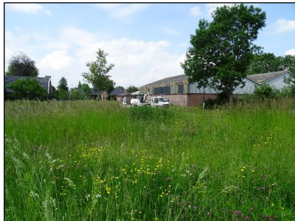
Figuur 6. Perceel aan de zuidzijde van de Taxhof.