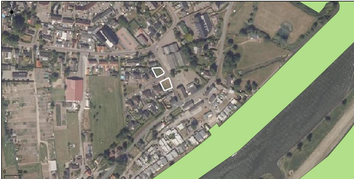
Figuur 10. Ligging onderzoekslocatie (wit omljnd) ten opzichte van het Natuurnetwerk Nederland (lichtgroene vlakken).

De onderzoekslocatie maakt geen deel uit van het Natuurnetwerk. De onderzoekslocatie ligt echter wel in de nabijheid van een gebied, behorend tot het Natuurnetwerk Nederland. Het meest nabijgelegen gebied bevindt zich circa 110 meter ten zuidoosten van de onderzoekslocatie. In figuur 10 is de ligging van de onderzoekslocatie ten opzichte van het Natuurnetwerk Nederland weergegeven.