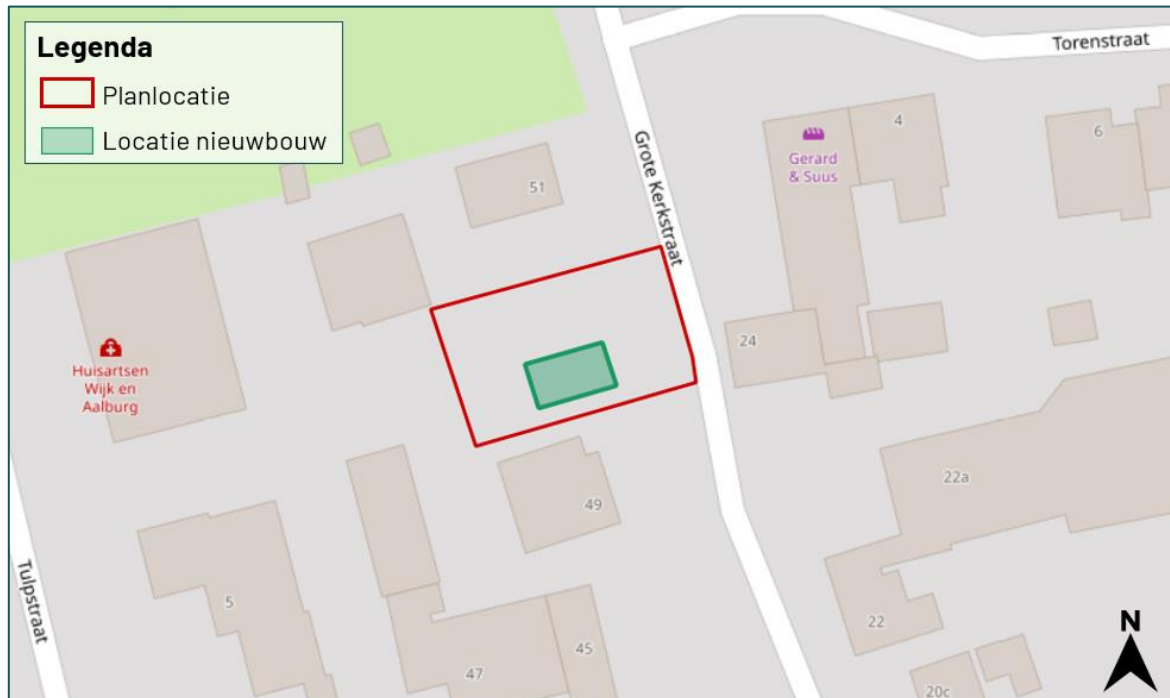
Figuur 1.2 De planlocatie (rood omkaderd) is gelegen aan de Grote kerkstraat ong. te Wijk en Aalburg.

De planlocatie is gelegen aan de Grote kerkstraat ong. te Wijk en Aalburg (figuur 1.2). De planlocatie bestaat uit een onderhouden (moes)tuin waarop verschillende aangeplante groenstructuren groeien. Op de planlocatie is geen bebouwing aanwezig. In figuur 1.3 en bijlage 1 zijn een aantal foto's opgenomen die een impressie geven van de planlocatie en de directe omgeving hiervan.