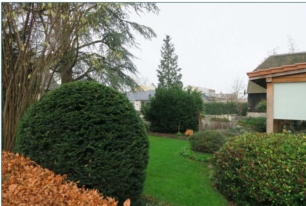
Figuur 2 De planlocatie bestaat uit een goed onderhouden tuin.