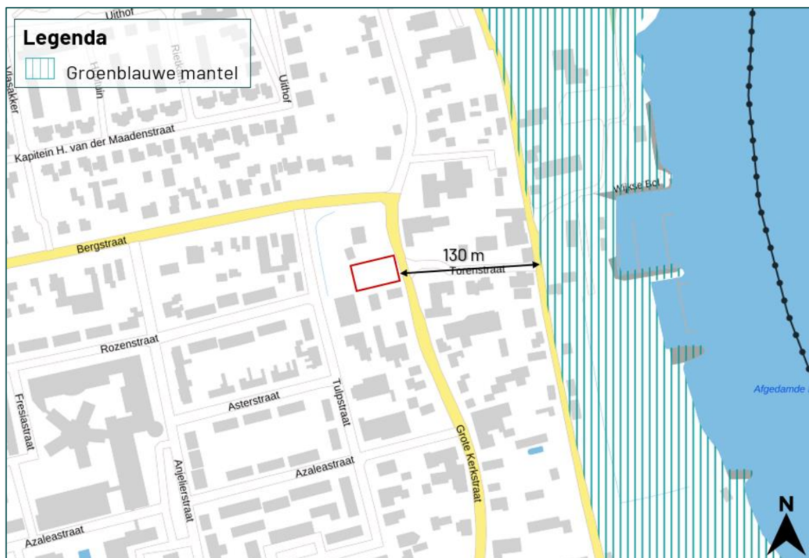
Figuur 3.3 De planlocatie ligt op een afstand van circa 130 m tot de Groenblauwe mantel.