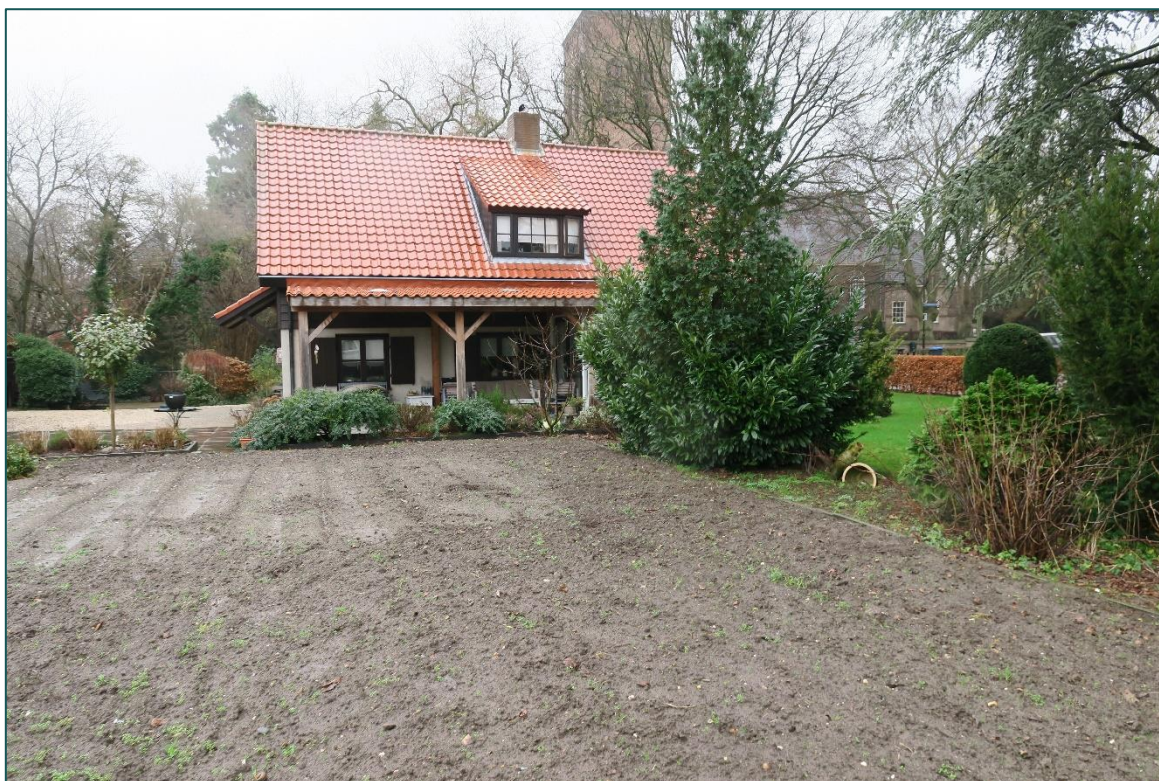
Figuur 1 De planlocatie is gelegen aan de Grote kerkstraat ong. te Wijk en Aalburg.