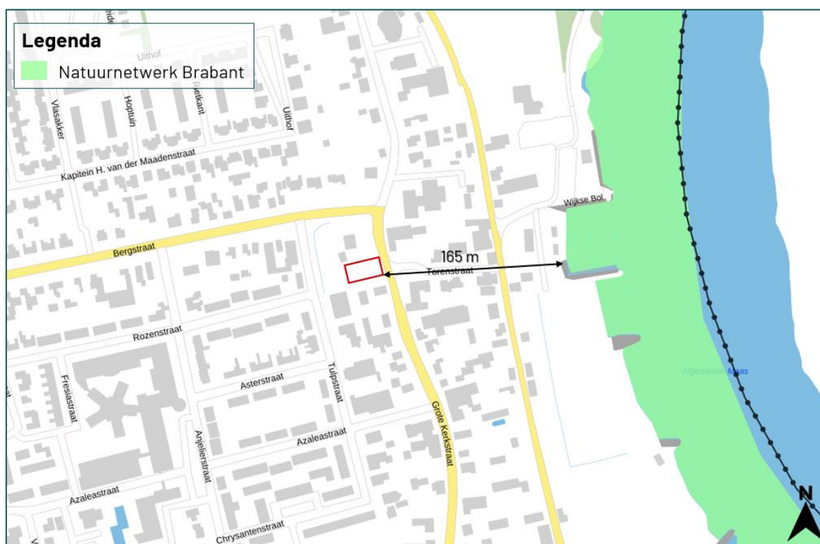
Figuur 3.2 De planlocatie ligt op een afstand van circa 165 m tot het Natuurnetwerk Brabant.

De planlocatie maakt geen deel uit van een beschermd gebied betreffende het Natuurnetwerk Brabant of de Groenblauwe mantel. Op een afstand van circa 165 m ligt het Natuurnetwerk Brabant (figuur 3.2). Op een afstand van circa 130 m ligt de Groenblauwe mantel (figuur 3.3). Ten aanzien van het Natuurnetwerk Brabant geldt dat externe werking (o.a. geluid, licht of betreding) een toetsingskader biedt. Gezien de afstand tussen de planlocatie en het Natuurnetwerk Brabant zijn negatieve effecten wegens de beoogde ruimtelijke ingreep op het Natuurnetwerk Brabant op voorhand uit te sluiten.