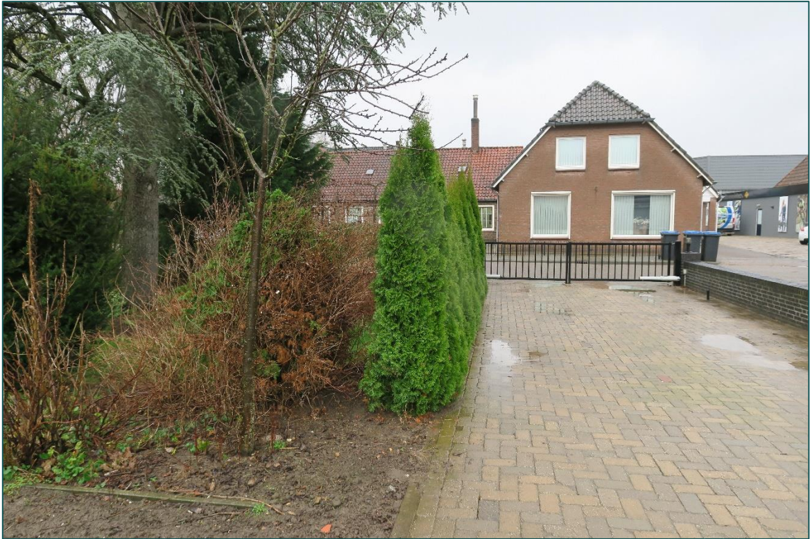
Figuur 3 De zuidzijde van de planlocatie.