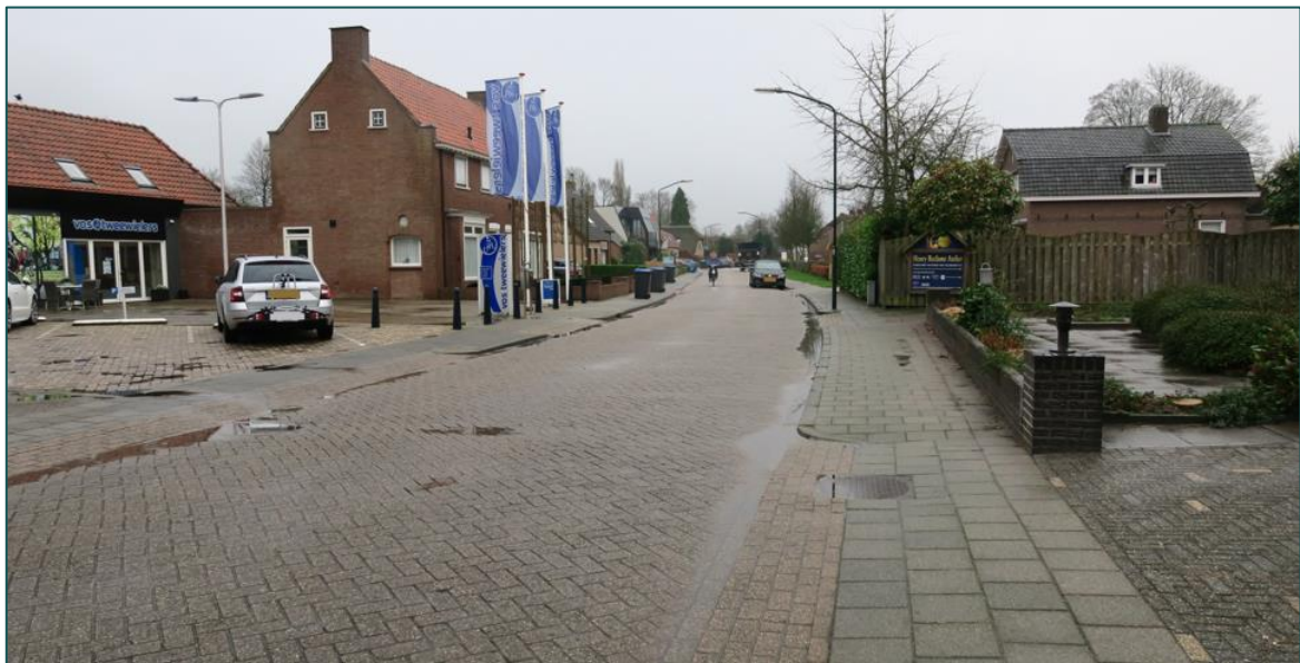
Figuur 1.3 Fotografische indruk van de omgeving van de planlocatie.

De directe omgeving van de planlocatie wordt gekenmerkt door de bebouwde kom van Wijk en Aalburg welke bestaat uit woonhuizen en onderhouden tuinen. Op een afstand van circa 230 m ten oosten van de planlocatie stroomt de Afgedamde Maas. Op een afstand van circa 2,2 km ten zuiden van de planlocatie stroomt de Maas. Op een afstand van circa 1,6 km ten westen van de planlocatie ligt de N267.