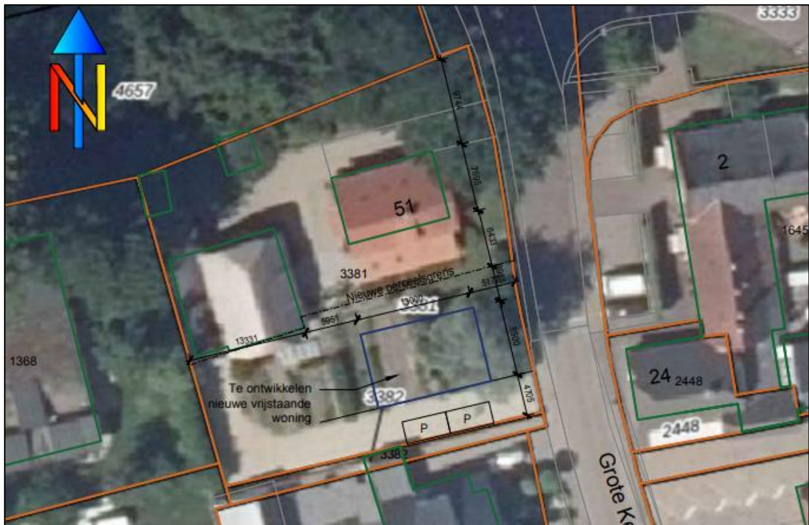
Figuur 1.4 Visuele representatie van de beoogde situatie.