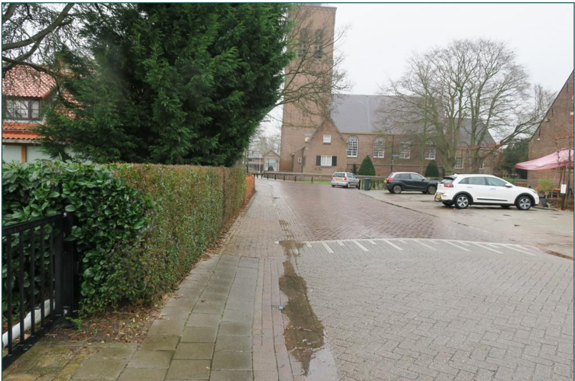
Figuur 4 De omgeving van de planlocatie bestaat uit de bebouwde kom van Wijk en Aalburg.