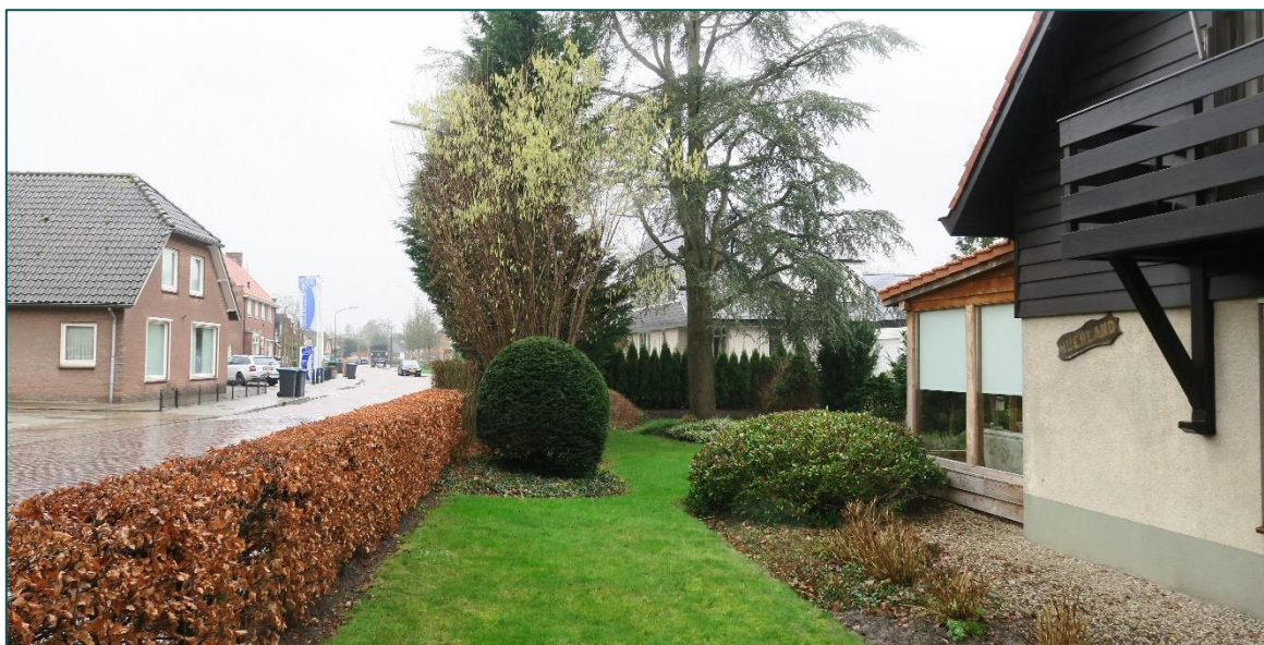
Figuur 1.1 De planlocatie is gelegen te Grote kerkstraat ong. te Wijk en Aalburg.