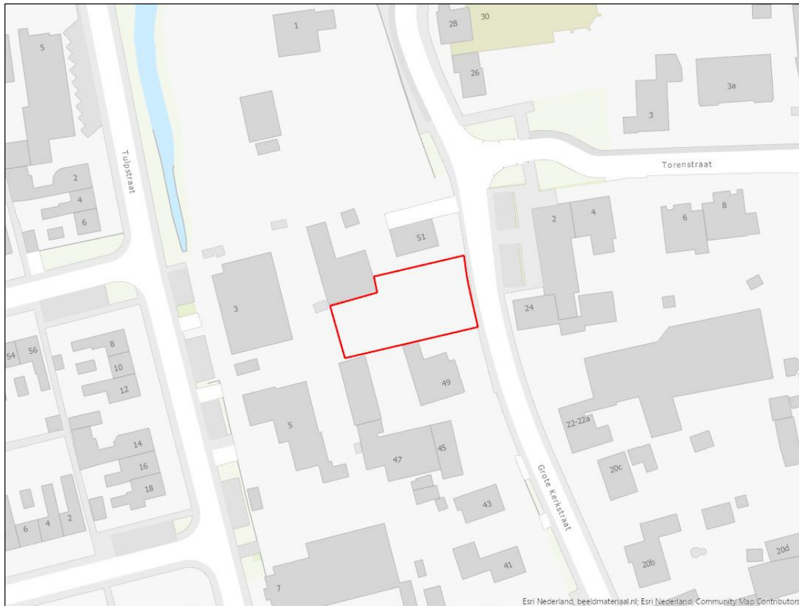
Figuur 1: Projectgebied Grote Kerkstraat 51, Wijk en Aalburg.

U bent voornemens om grondroerende werkzaamheden uit te voeren binnen de gemeente Altena. Uit de gemeentedeckende risicokaart is gebleken dat uw projectgebied zich binnen een op ontplofbare oorlogsresten (OO) verdacht gebied bevindt. Op 30 mei 2023 is derhalve een aanvraag gedaan voor een Locatiegebonden Explosieven Inventarisatie (LEI) ter plaatse van de Grote Kerkstraat 51 te Wijk en Aalburg