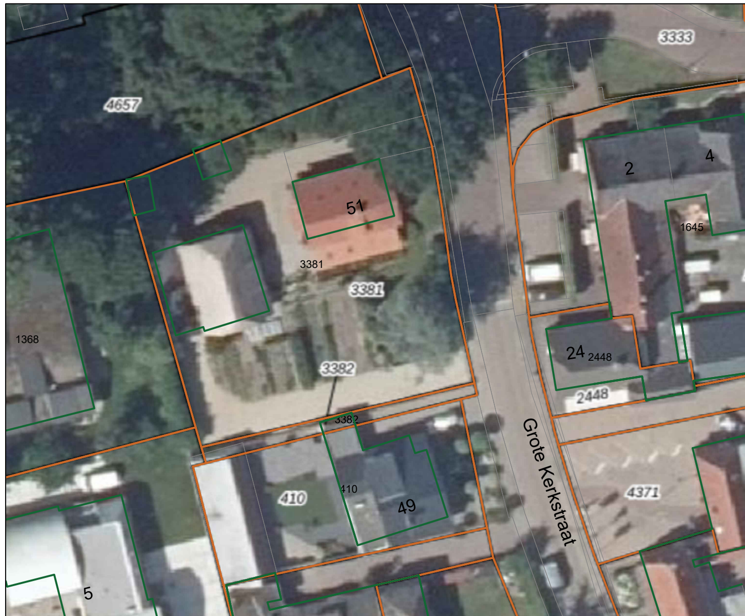
Kadastrale kaart bestaande situatie 1:500