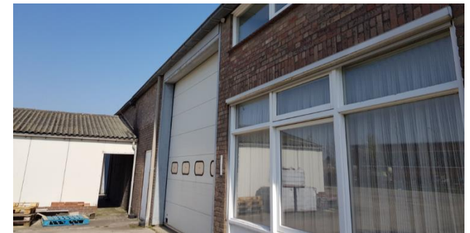
Figuur 6: Bedrijfsgebouw binnen plangebied