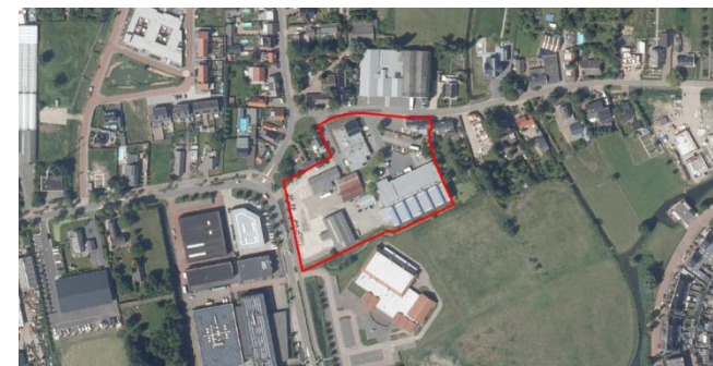
Figuur 2: Luchtfoto plangebied en directe omgeving