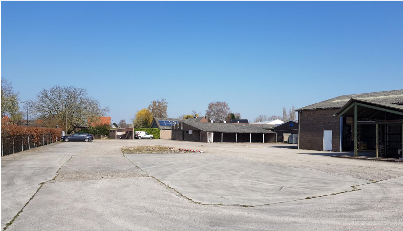
Figuur 4: Overzicht plangebied vanuit het zuidwesten