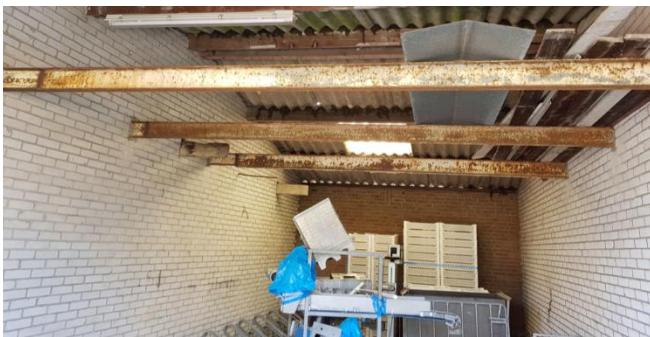
Figuur 7: Binnenkant bedrijfsgebouw plangebied