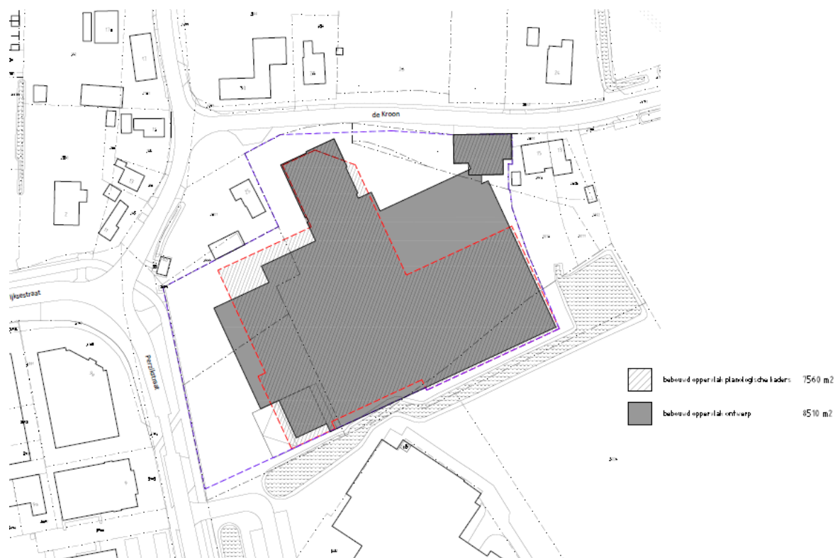
Figuur 3: Concept toekomstige situatie plangebied