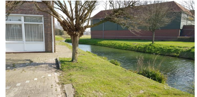
Figuur 5: B-watergang ten zuiden van het plangebied