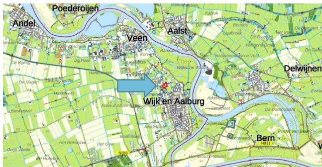
Figuur 1: Topografische kaart ligging plangebied (1:25.000)

De initiatiefnemer is voornemens om de verschillende solitaire gebouwen in één gebouw te concentreren. Vanwege deze redenen is sloop van een deel van de bestaande bebouwing en nieuwbouw van een bedrijfshal gewenst. Het kantoor en de werkplaats blijven behouden. Het gewenste programma bestaat uit in totaal ca. 10.500 m 2 (bvo), dit is inclusief de te handhaven bebouwing in het projectgebied. Figuur 3 geeft een beeld van het concept van de toekomstige situatie.