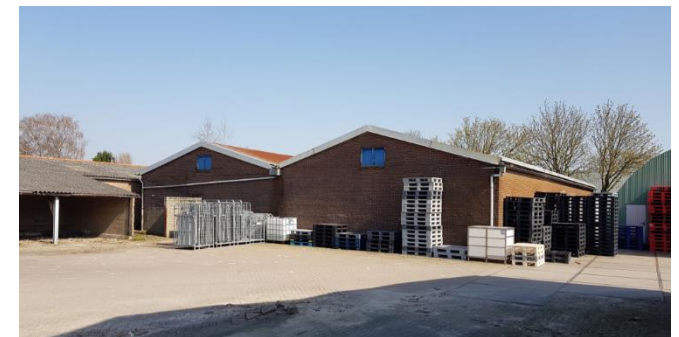
Figuur 9: Bedrijfsgebouw binnen plangebied