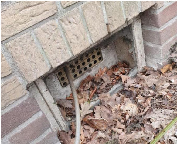
Geen openingen voor marters e.d.