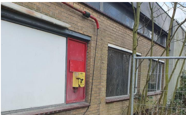
Gevel is dicht, wel wat kleine openingen, niet geschikt voor nestplaats

Hieronder zijn de foto's van het perceel weergegeven: