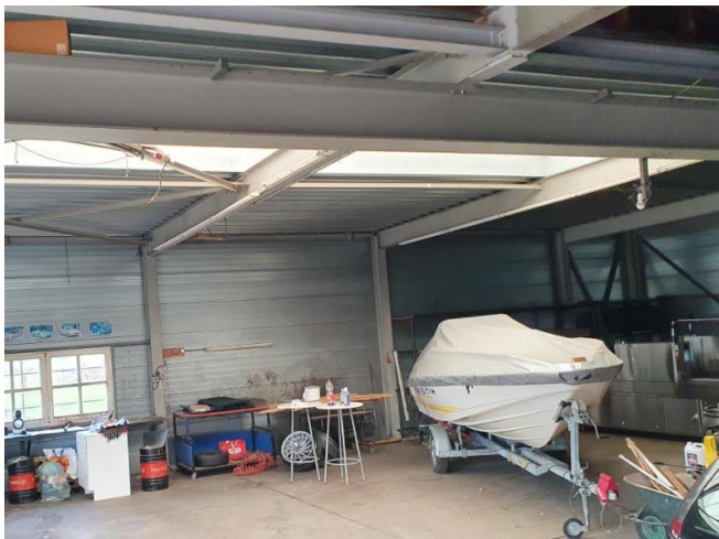
Werkplaats ongeschikt als nestplaats