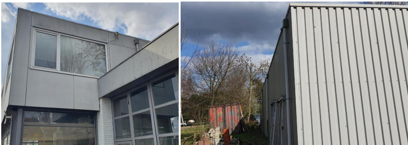
Daken niet geschikt als nestplaats