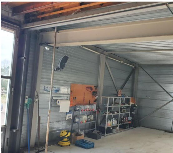
Binnen geen mogelijkheid voor nestplaatsen