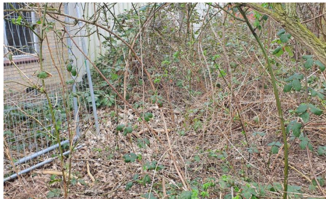
Groen is onderzocht, geen sporen van vogels, egels enz