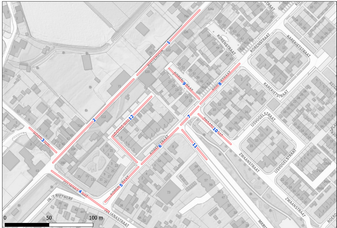
Figuur 2: Onderzoeksgebied met straatsectie-indeling

Figuur 2 toont het onderzoeksgebied met bijbehorende straatsectie-indeling. De gehanteerde straatsectienummering correspondeert met de nummering in de resultaat tabellen.