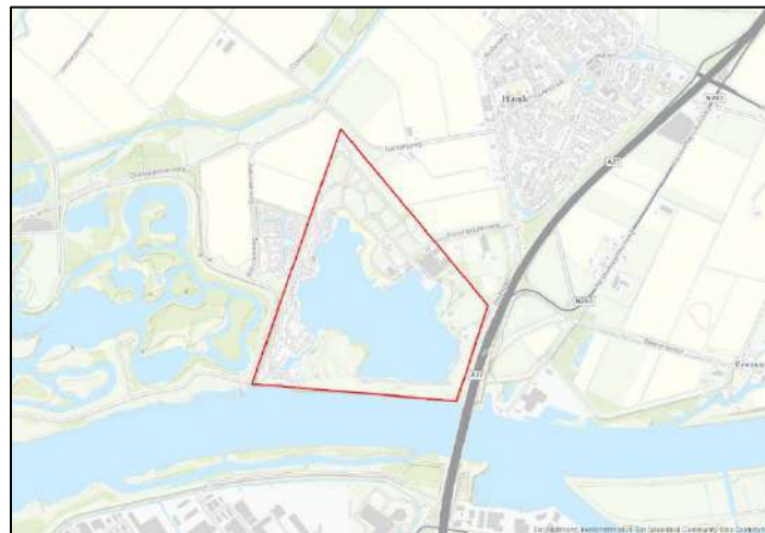
Figuur 1: Onderzoeksgebied (bij benadering) Kurenpolder – Hank.

In opdracht van de Gemeente Altena voert Bodac B.V. een historisch onderzoek conflictperiode 'H1067 BOO Gemeente Altena' uit. De gemeente heeft plannen op korte termijn bodemroerende werkzaamheden uit te voeren in/nabij de Kurenpolder te Hank. De Kurenpolder valt onder deelgebied 4 (Dussen, Made en Drimmelen, Hooge -en Lage Zwaluwe) van voornoemd gemeentedeckend historisch vooronderzoek. Dit deelgebied wordt momenteel door Bodac B.V. onderzocht. Diverse bronnen en data dienen nog te worden geraadpleegd en geëvalueerd. In deze MEMO wordt derhalve een inschatting c.q. voorlopige conclusie gegeven met de informatie die wij tot nu toe voorhanden hebben. De bevindingen uit dit document dienen daarom met nadruk niet als 'bindend' en slechts als 'richtinggevend' te worden opgevat. Op basis van het lopende onderzoek kan nieuwe informatie aan de orde komen en/of kunnen andere conclusies worden getrokken. In onderstaande Figuur 1 wordt de Kurenpolder (bij benadering) weergegeven.