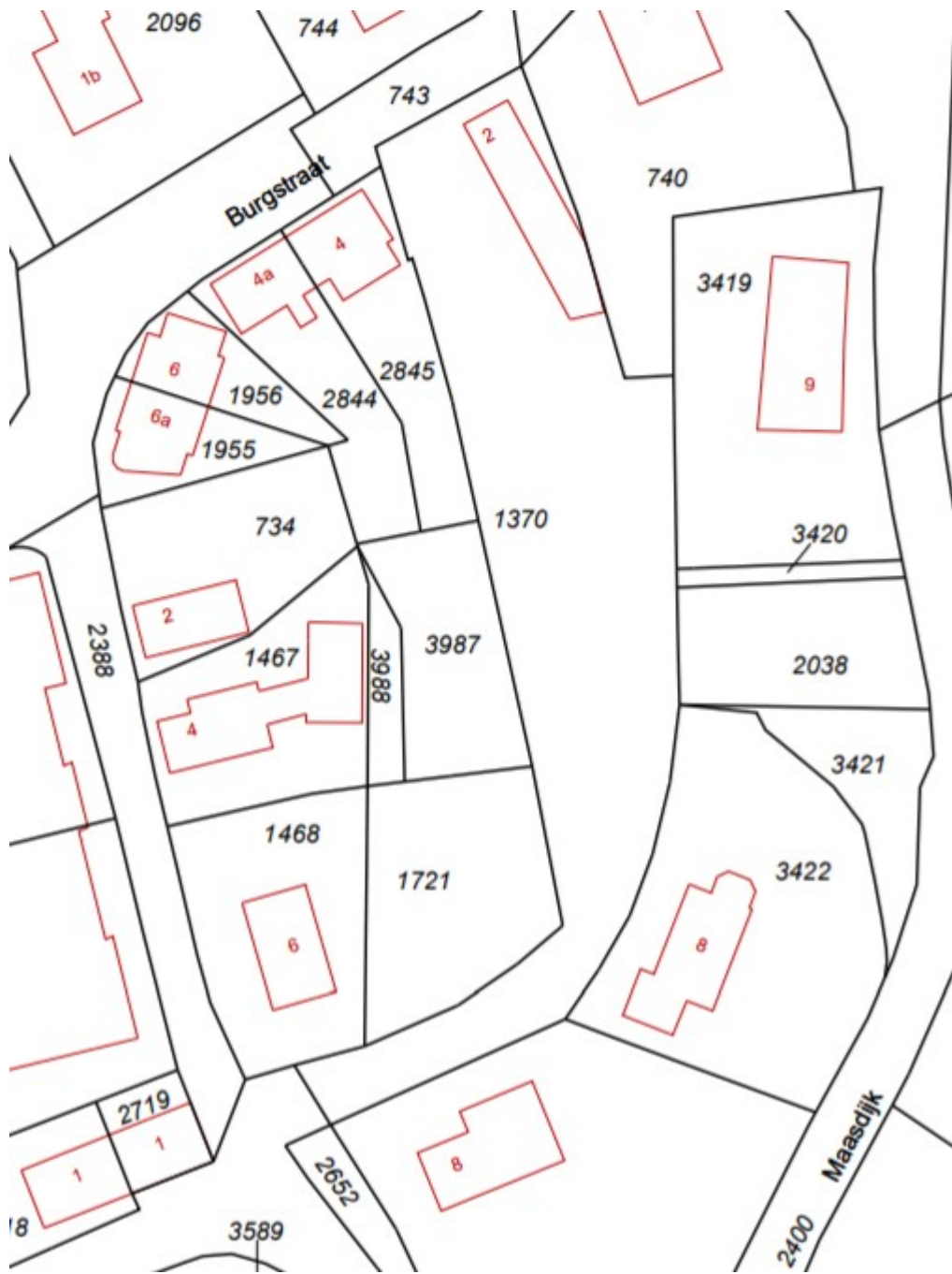
Afbeelding 9: bedrijfslocatie Quasar B.V. (perceelnummers 1370, 3987)