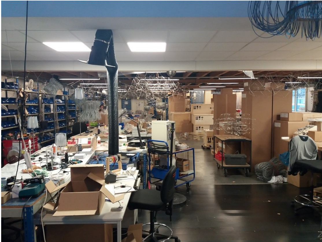
Afbeelding 5 en 6: atelier en tevens inpakruimte met dozen