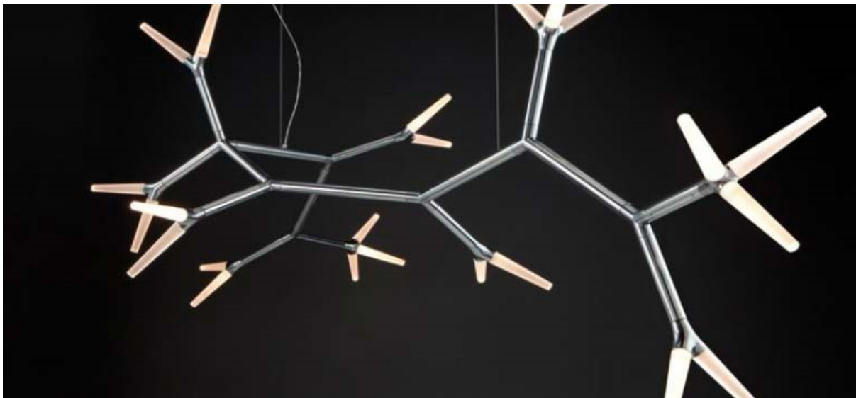
Afbeelding 8 : voorbeeld van door Quasar gemaakte designarmatuur (Sparks Daniel Becker)