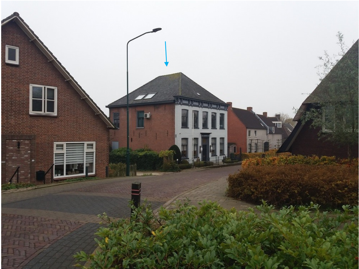
Afbeelding 7 : voor- en zijaanzicht kantoorpand Quasar B.V. aan de Burgstraat 2