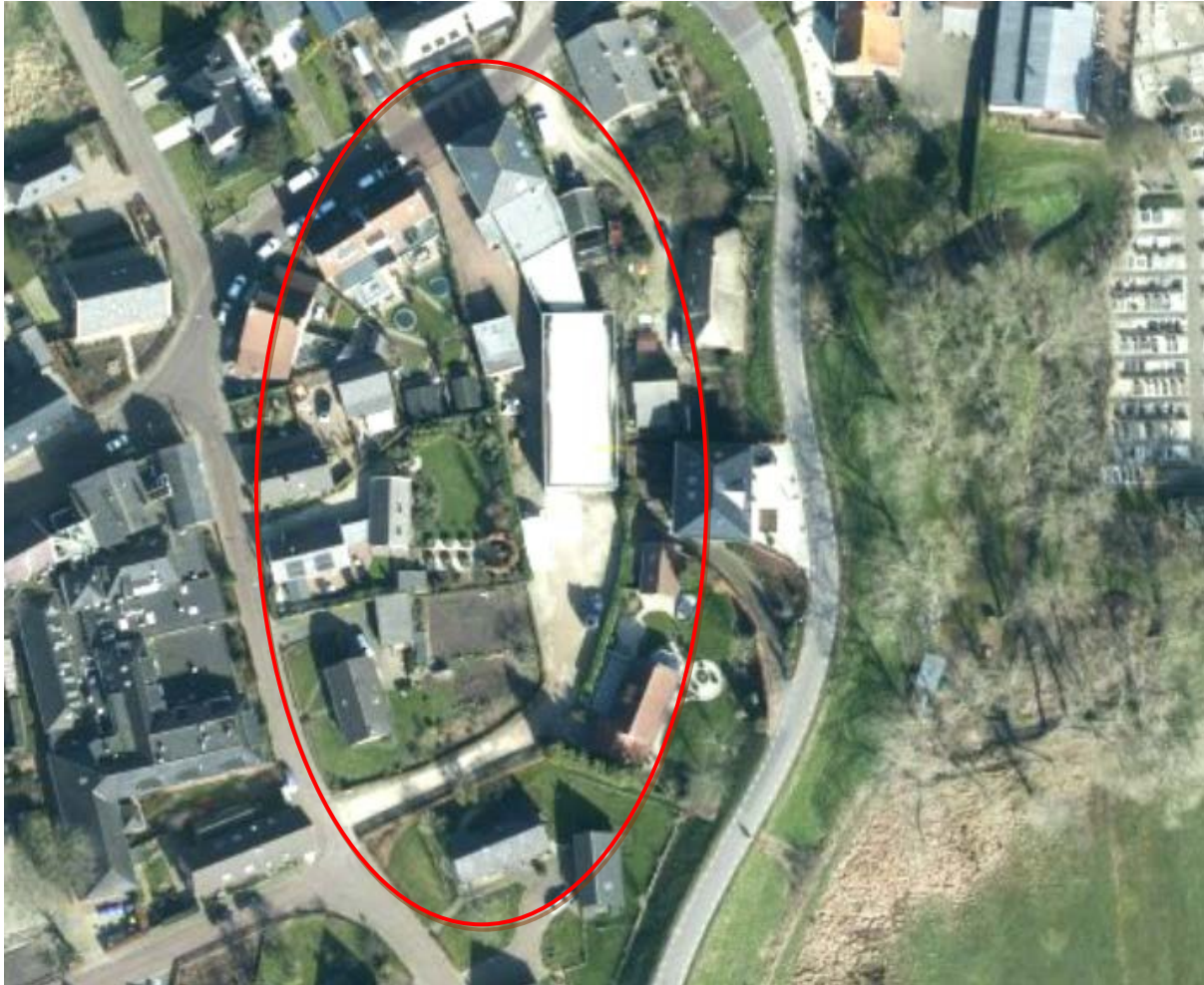
Afbeelding 1 : luchtfoto ligging bedrijfslocatie Burgstraat 2 en nabije omgeving

De bedrijfslocatie van Quasar B.V. ligt aan de Burgstraat 2 nabij de rand van het dorp Giessen in de gemeente Woudrichem. In de omgeving liggen woningen, kantoren en op zo'n 100 meter afstand van het bedrijfsperceel ligt het bedrijf Hak B.V. Voor een impressie van de omgeving, zie de luchtfoto bij afbeelding 1.