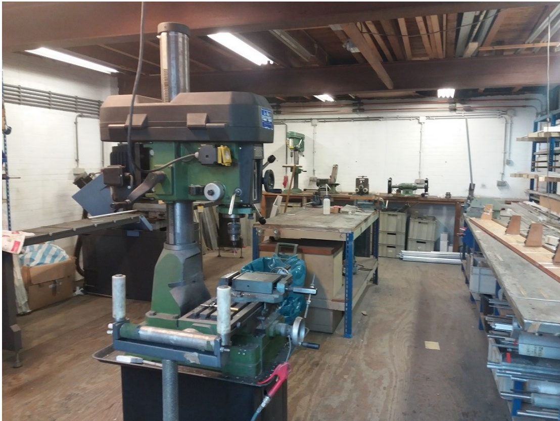
Afbeelding 4 : foto werkplaats voor bewerking materiaal

Quasar B.V. is een bedrijf dat zich richt op het assembleren en verkopen van op maat gemaakte verlichtingsarmaturen. Een armatuur is een draagconstructie met een fitting voor één of meerdere lichtbronnen. Deze kunnen aan plafonds of muren worden bevestigd. De armaturen worden verkocht in het hoge segment en worden speciaal op maat voor klanten ontworpen. Het betreft een niche-markt. De ontwerpen hangen in exclusieve restaurants, hotels en musea. In Nederland onder meer in de foyer van de musical Soldaat van Oranje en het Ministerie van Buitenlandse Zaken. Ontwerp en fabricage van de onderdelen vindt elders plaats. Alleen assemblage en kleinschalige bewerking vindt op de locatie plaats in een kleine werkplaats (zie foto bij afbeelding 4). In het atelier worden vervolgens alle elementen door medewerkers met de hand in elkaar gezet en zorgvuldig verpakt in dozen om vervoerd te worden. Deze activiteiten vinden in pandig plaats.