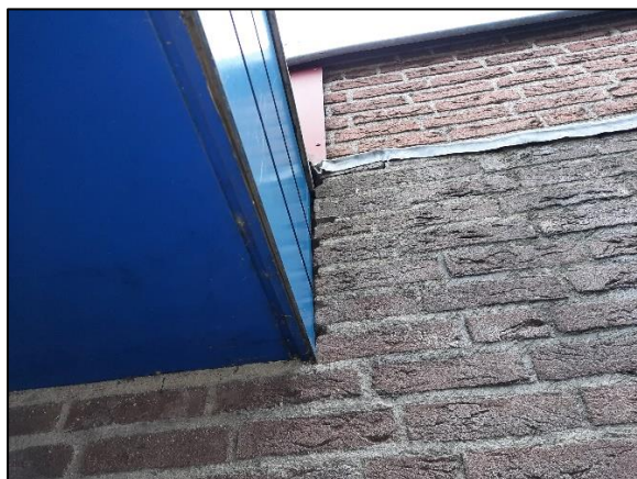
Figuur 5.1. Ruimte langs de daklijst van de aanwezige bebouwing.

Volgens verspreidingsgegevens en de verspreidingsatlas van de NDFF en vleermuis.net is de onderzoekslocatie gelegen in een deel van Nederland waar de volgende vleermuissoorten kunnen voorkomen: gewone dwergvleermuis , ruige dwergvleermuis , rosse vleermuis , laatvlieger , gewone grootoorvleermuis , meervleermuis en de watervleermuis .