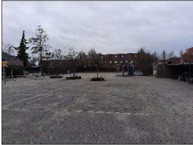
Figuur 2.3 Schoolplein aan noordzijde van onderzoekslocatie.