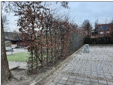
Figuur 2.6 Haag aan de noordkant van de onderzoekslocatie.