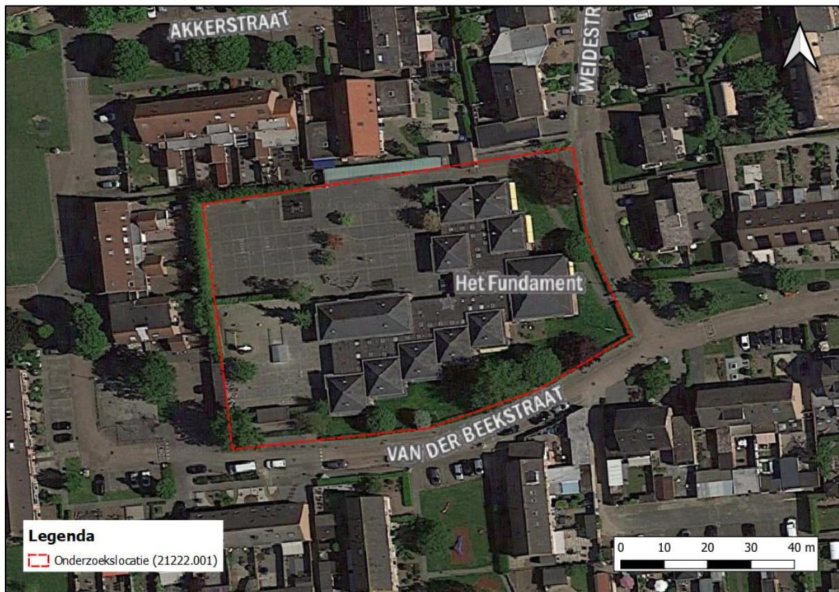
Figuur 2.2. Luchtfoto onderzoekslocatie en directe omgeving.

In Fout! Verwijzingsbron niet gevonden. is een luchtfoto van de onderzoekslocatie en de directe omgeving weergegeven. Figuur 2.3 t/m figuur 2.8 geven een impressie van de onderzoekslocatie, middels foto's die zijn genomen tijdens het veldbezoek.