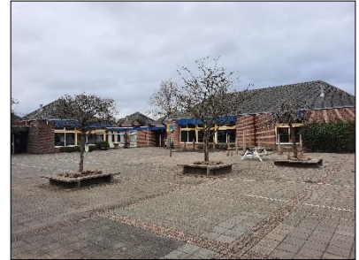
Figuur 2.5 Noordwestkant van de bebouwing.