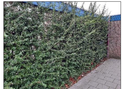
Figuur 2.8 Haag aan de zuidkant van de onderzoekslocatie.