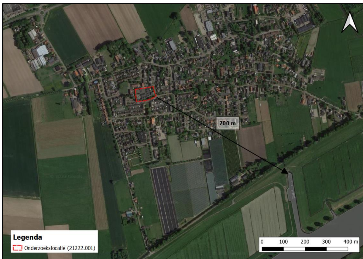
Figuur 7.2 Ligging onderzoekslocatie ten opzichte van het Natuurnetwerk Nederland.

De onderzoekslocatie maakt geen deel uit van het Natuurnetwerk. Het meest nabijgelegen gebied bevindt zich circa 700 meter ten Zuidwesten van de onderzoekslocatie. In figuur 7.2 is de ligging van de onderzoekslocatie ten opzichte van het Natuurnetwerk Nederland weergegeven.