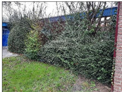
Figuur 2.7 Bosschage aan de zuidkant van de onderzoekslocatie.