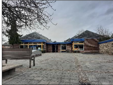
Figuur 2.4 Noordoostkant van de bebouwing.