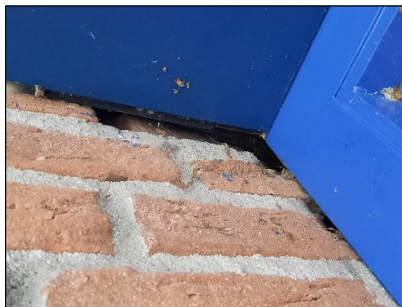
Figuur 5.2. Ruimte tussen de daklijst en de gevel van de aanwezige bebouwing.