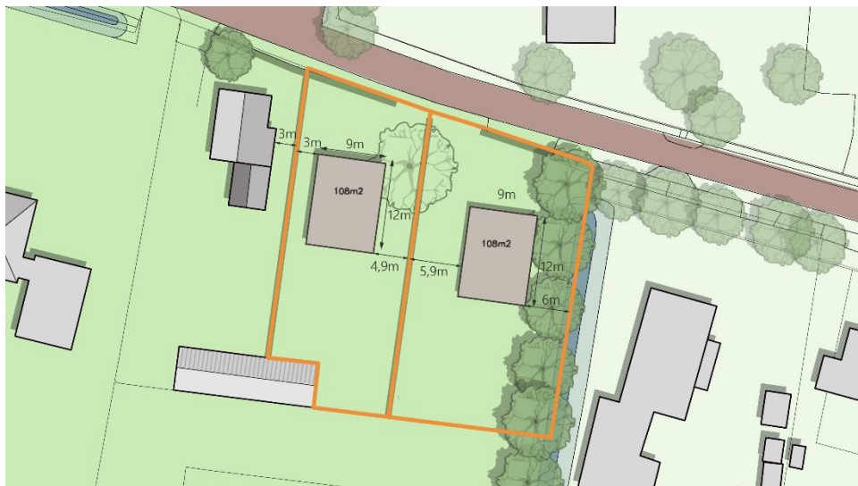
Beoogde situatie (maatvoering is indicatief)

De planlocatie ligt dicht bij de dorpsgrens van Drongelen. De brug ten westen van huisnummer 3 vormt een duidelijke overgang tussen buitengebied en het dorp. Doordat de eerste woning na de brug, huisnummer 3, ver van de weg ligt ontstaat een zachte overgang tussen dorp en buitengebied. Nummer 1 staat aan de splitsing van de Eindsestraat en de Achterstraat en staat relatief dicht op de weg waardoor