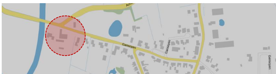
Verspreidingsgebied uitnodiging omgevingsdialoog

De uitnodigingsbrief voor de omgevingsdialoog is verspreid binnen het onderstaande gebied. Naast de woningen van de initiatiefnemers vallen de woningen van twee burens in de cirkel. Daarnaast is tevens aan de dorpsraad van Drongelen een uitnodiging om deel te nemen gestuurd.