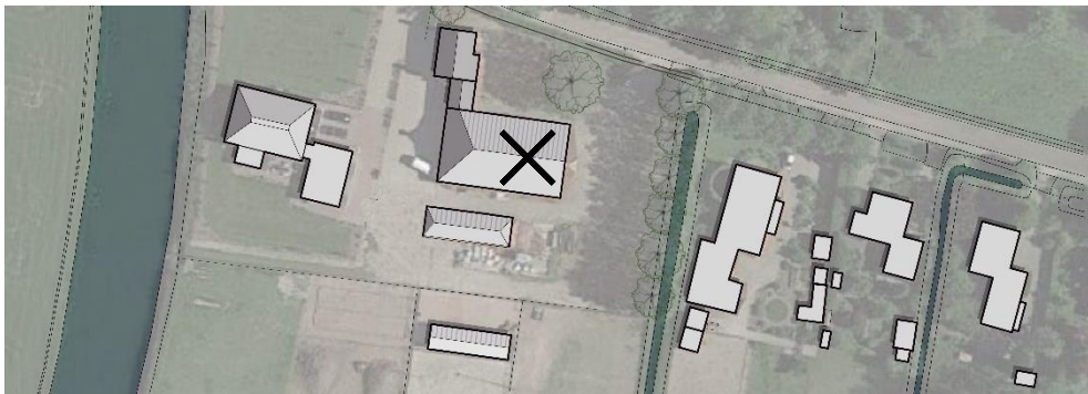
Te slopen bebouwing.

Het plan betreft de sloop van de grote schuur en het creëren van twee extra woonkavels. In de nieuwe situatie zal de bestaande woning (Eindsestraat 1) behouden blijven. Op onderstaande tekening is aangegeven met een kruis welke bebouwing gesloopt zal worden. De te slopen bebouwing is in een te slechte staat om te behouden.