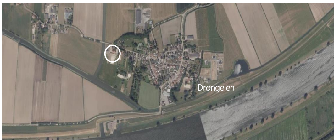
Ligging plangebied

Het plangebied ligt in het westen van de kern Drongelen. Het plangebied wordt in het oosten begrensd door het woonperceel van Gansoyen 49, aan de westzijde door het nieuwe woonperceel Eindsestraat 1, aan de noordzijde door de Eindsestraat en aan de zuidzijde door een open landschap met een agrarisch karakter.