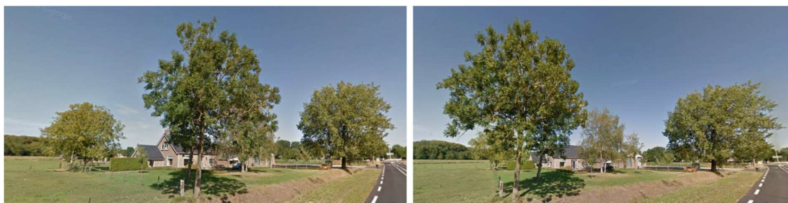
Tuin bedrijfswoning anno 2016 met grote bomen en gras gezien vanaf Grotewaardweg vanuit zuid zuidoost.