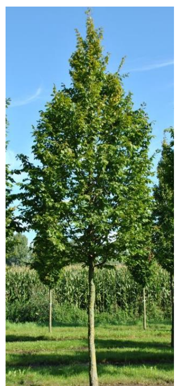
12 x Carpinus betulus.

GROENSTROOK II Afmeting : ca. 85 x 1,25 m. (106 m 2 ). SPECIFICATIE: Bomen: • 4 st. Prunus avium (Wilde kers). • 5 st. Carpinus betulus (Haagbeuk). Bomen h.o.h. ca. 10 m. 1 solitaire boom op 0,3 m. uit de erfgrans geplant. 280 st. inheems bosplantsoen bestaande uit: • Acer campestre (Veldesdoorn). • Carpinus betulus (Haagbeuk). • Fagus sylvatica (Beuk). • Cornus sanguinea (Rode kornoelje). • Cornus mas (Gele kornoelje). Plantsoen aan te planten in 2 rijen met een tussenstand van ca. 1 m. (kruislings). 1 e rij 0,25 m. uit de erfgrans en 2 e rij 0,75 m. uit de erfgrans.