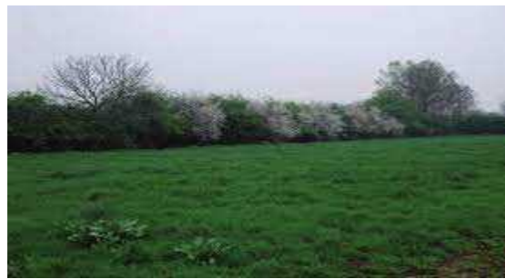
Lage heesterbeplanting + enkele solitaire bomen