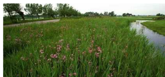
Zoekzone EVZ + zoekzone water (ten opzichte van vigerend bestem- mingsplan buitengebied verplaatst) (breedte 20,00 m)