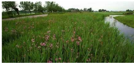
Zoekzone EVZ + zoekzone water (ten opzichte van vigerend bestem- mingsplan buitengebied verplaatst) (breedte 20,00 m)