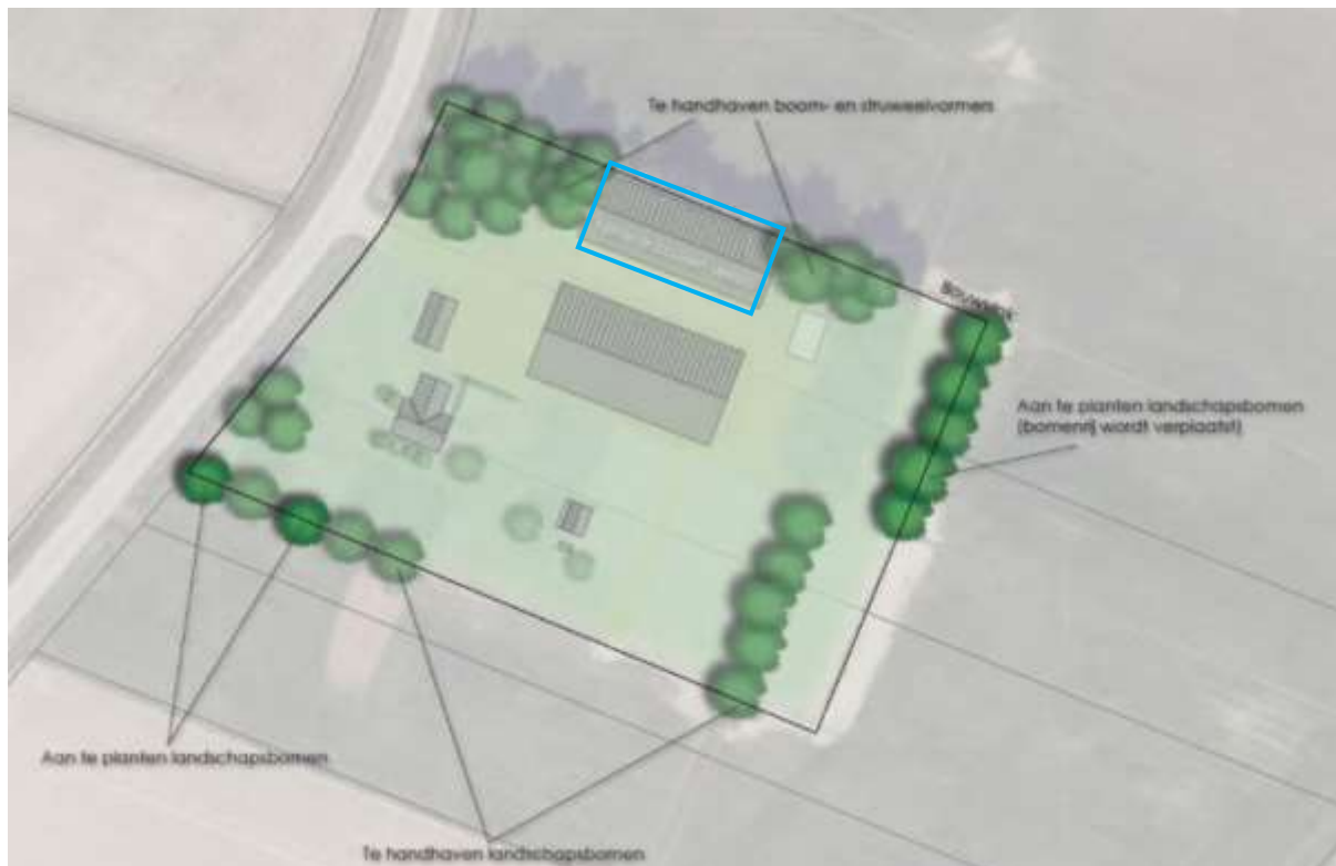
Beoogde situatie met nieuwe inpassing

Op onderstaande afbeelding een overzicht van de bestaande en te behouden bebouwing met de nieuwbouw in blauw omkaderd.