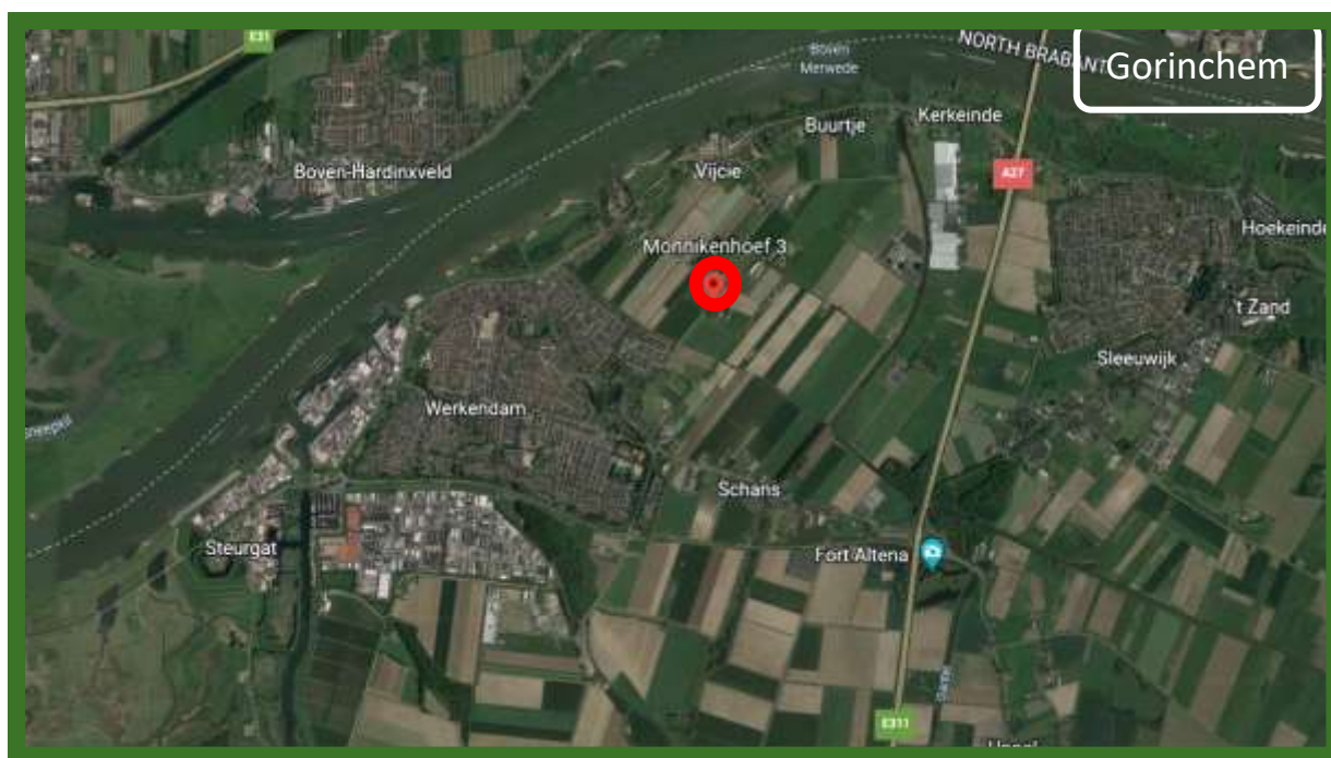
Satellietfoto omgeving plangebied, planlocatie is rood omcirkeld.

Het plangebied bevindt zich ten noordoosten van de bebouwingsconcentratie in Werkendam. De directe omgeving van het plangebied bestaat voornamelijk uit agrarische percelen en bedrijfsbestemmingen. De ligging van het plangebied in de ruimere omgeving is weergegeven in onderstaande afbeelding.