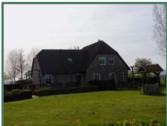
Bedrijfswoning met gecultiveerde tuin

In de ruigte aan de noord- en oostzijde van het plangebied staan voornamelijk bomen, zoals de populier en berk en struiken, zoals de hazelaar en meidoorn. De bodem van de ruigte was voornamelijk bedekt met detritus in de vorm van bladeren en zowel gevallen als gesnoeide takken.