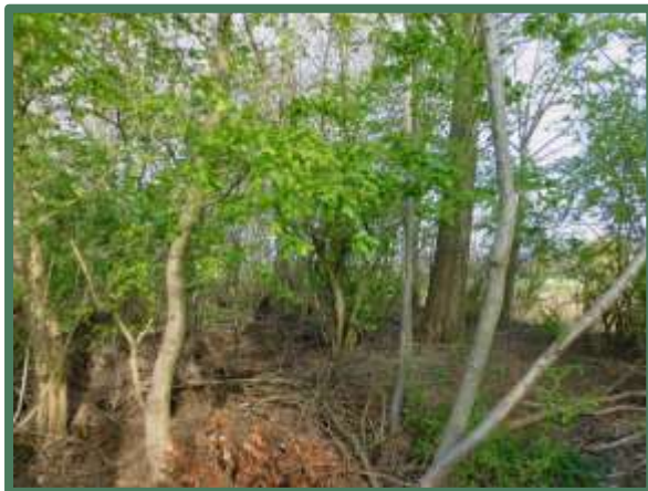
Vegetatie noordzijde met bodemlaag