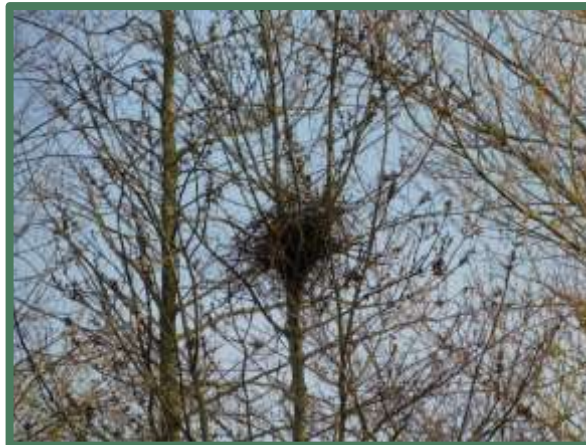
Kraaiennest noordelijke ruigte