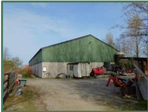
Gesloten zijde loods