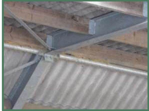
Nesten van huismussen in de loods