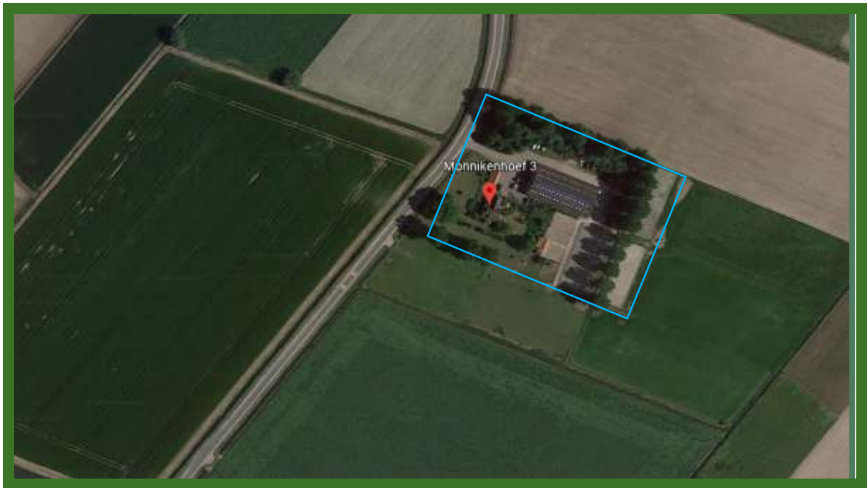
Globaal omliggende planlocatie in blauw.

Het plangebied bestaat uit een bedrijfswoning, een centrale loods en een kleine schuur. Het geheel ligt omsloten door agrarische percelen en aan de noord – en oostzijde bevindt zich erfbeplanting. Op onderstaande afbeelding wordt het plangebied globaal aangegeven.