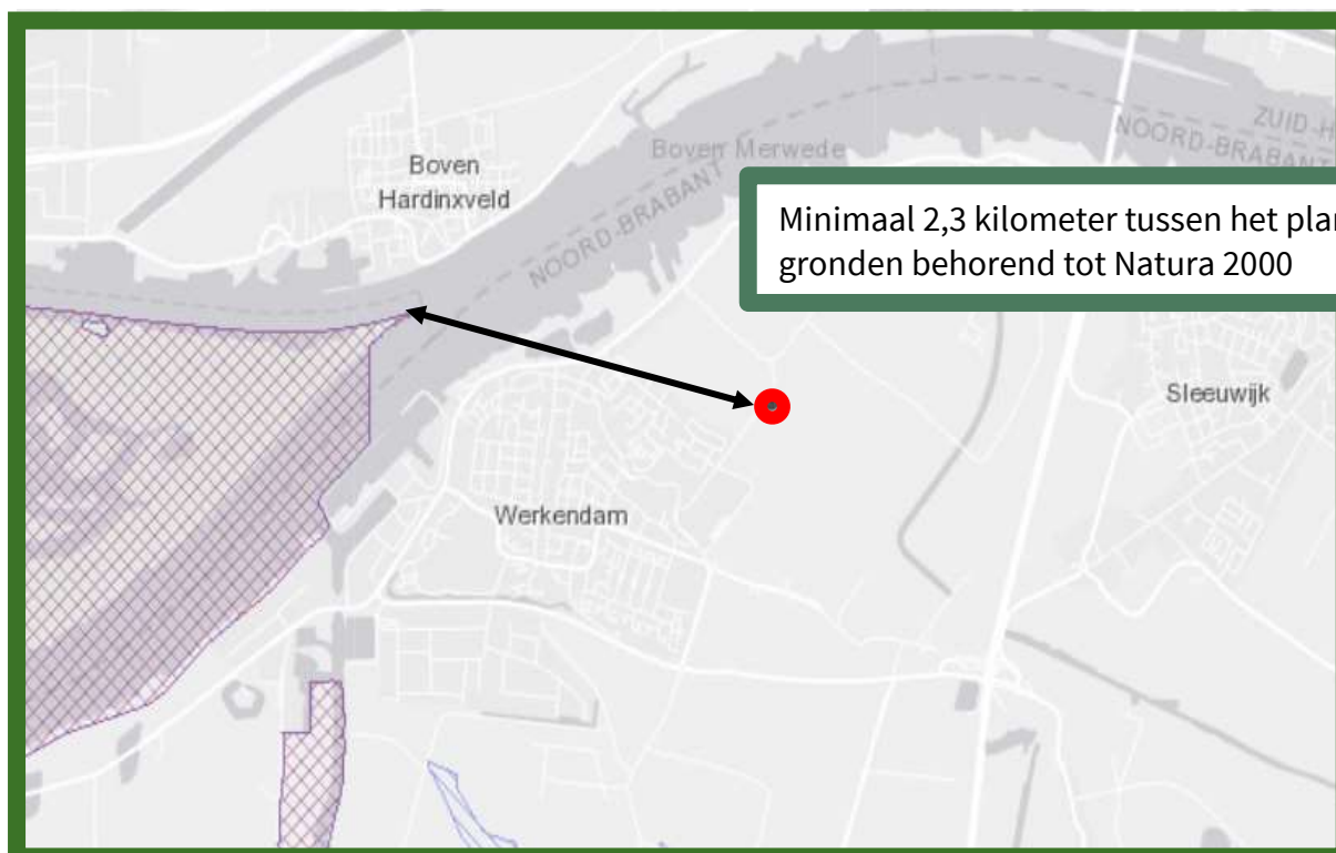
Natura 2000 gebieden. De afstand tussen het plangebied en Natura 2000 is met een pijl aangegeven.

Het plangebied ligt op minimaal 2,3 kilometer afstand van gronden die tot Natura 2000 gebied Biesbosch behoren. Op onderstaande afbeelding wordt de ligging van Natura 2000 gebieden in de omgeving van het plangebied weergegeven. De ligging van het plangebied wordt met een rode cirkel aangegeven. Natura 2000 gebieden zijn met gekruiste rood en blauwe strepen aangegeven.