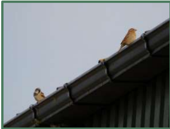
Huismussen op de dakrand van de loods

Het houden van rundvee op de planlocatie zal tot gevolg hebben dat er met voeders gemorst zal worden. Dit zal voor de aanwezige huismussen een uitbreiding van voedselaanbod betekenen. Ook zal de nieuw te bouwen potstal zodanig open zijn dat er meer nestmogelijkheden voor huismussen komen.