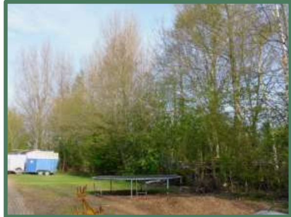
Vegetatie noordzijde met boomkruinen