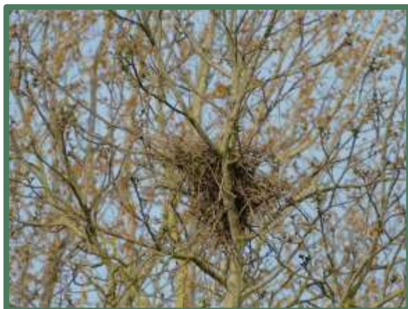
Houtduivennest noordelijke ruigte