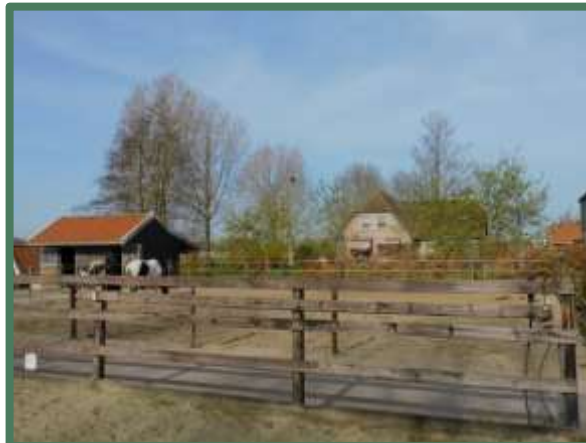
Houten schuur met paardenweide