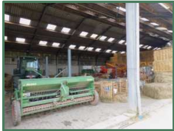
Open zijde loods