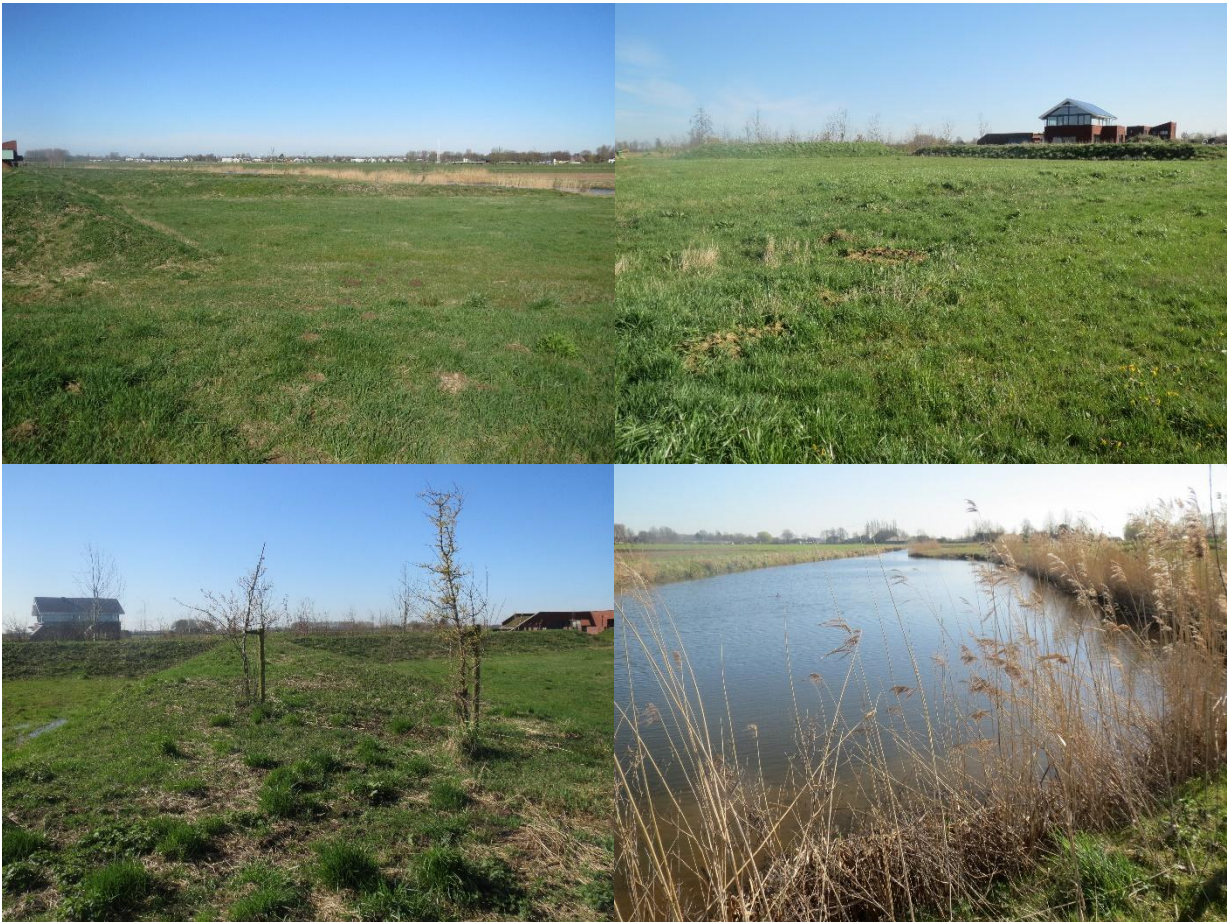
Figuur 2: Foto-impressie van het plangebied met links- en rechtsboven: overzicht van kavels, linksonder: een van de taluds tussen de kavels en rechtsonder watergang rondom eiland.