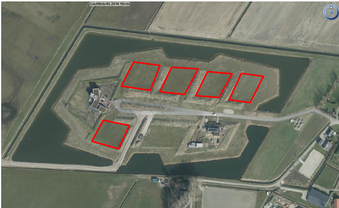
Figuur 1: Luchtfoto met bij benadering de kavels die tot het projectgebied behoren met rode contour weergegeven.

Het projectgebied betreft vijf kavels op een recent gerealiseerd eiland, binnen de gemeente Woudrichem. Het eiland bevindt zich in de polder tussen Sleeuwijk en Oudendijk, ten zuidwesten van Woudrichem. Op de drie andere kavels op het eiland zijn reeds woningen gebouwd, zie ook de luchtfoto in Figuur 1. Hierop is de woning die gebouwd is op het middelste kavel in het zuidelijk deel nog niet zichtbaar.