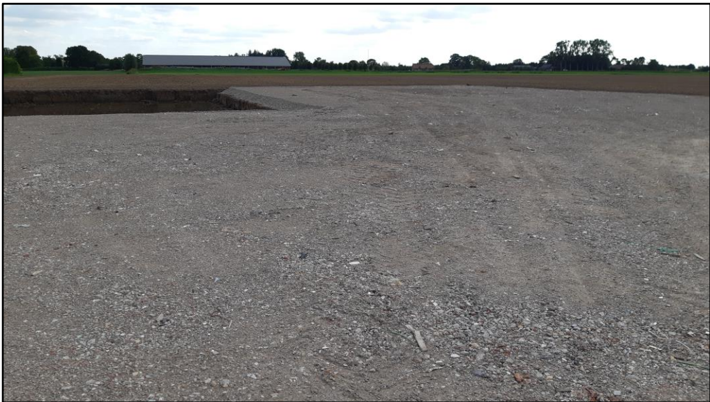
Figuur 4 Overzicht van het reeds met gebroken puin verharde gedeelte van de planlocatie.