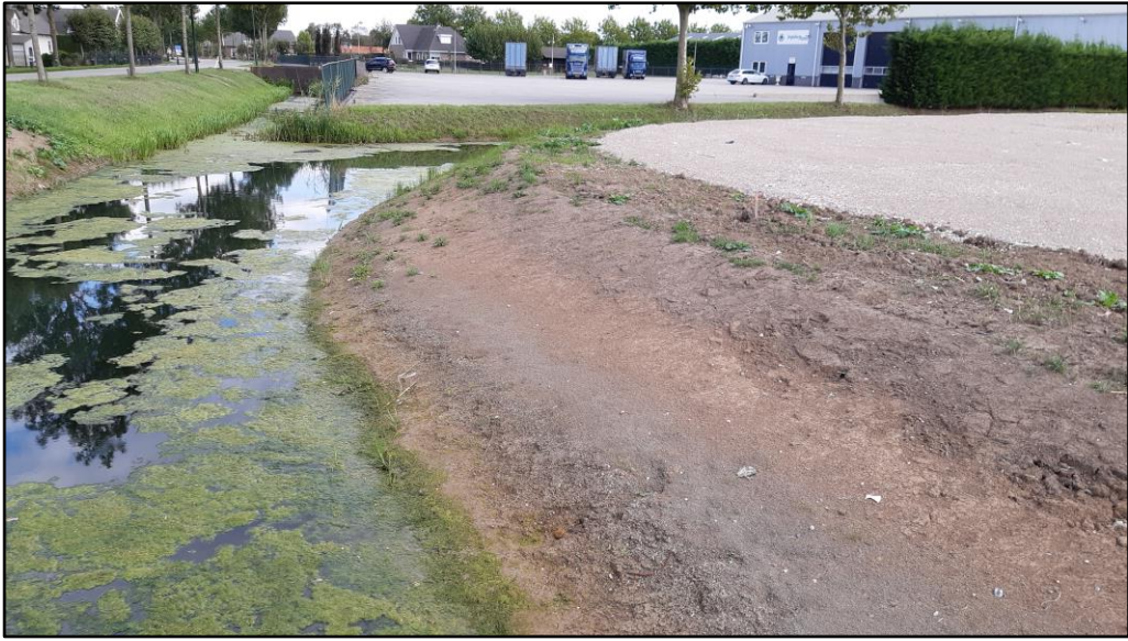
Figuur 3 Waterhoudende kavelsloot met ecologische oevers op de planlocatie.