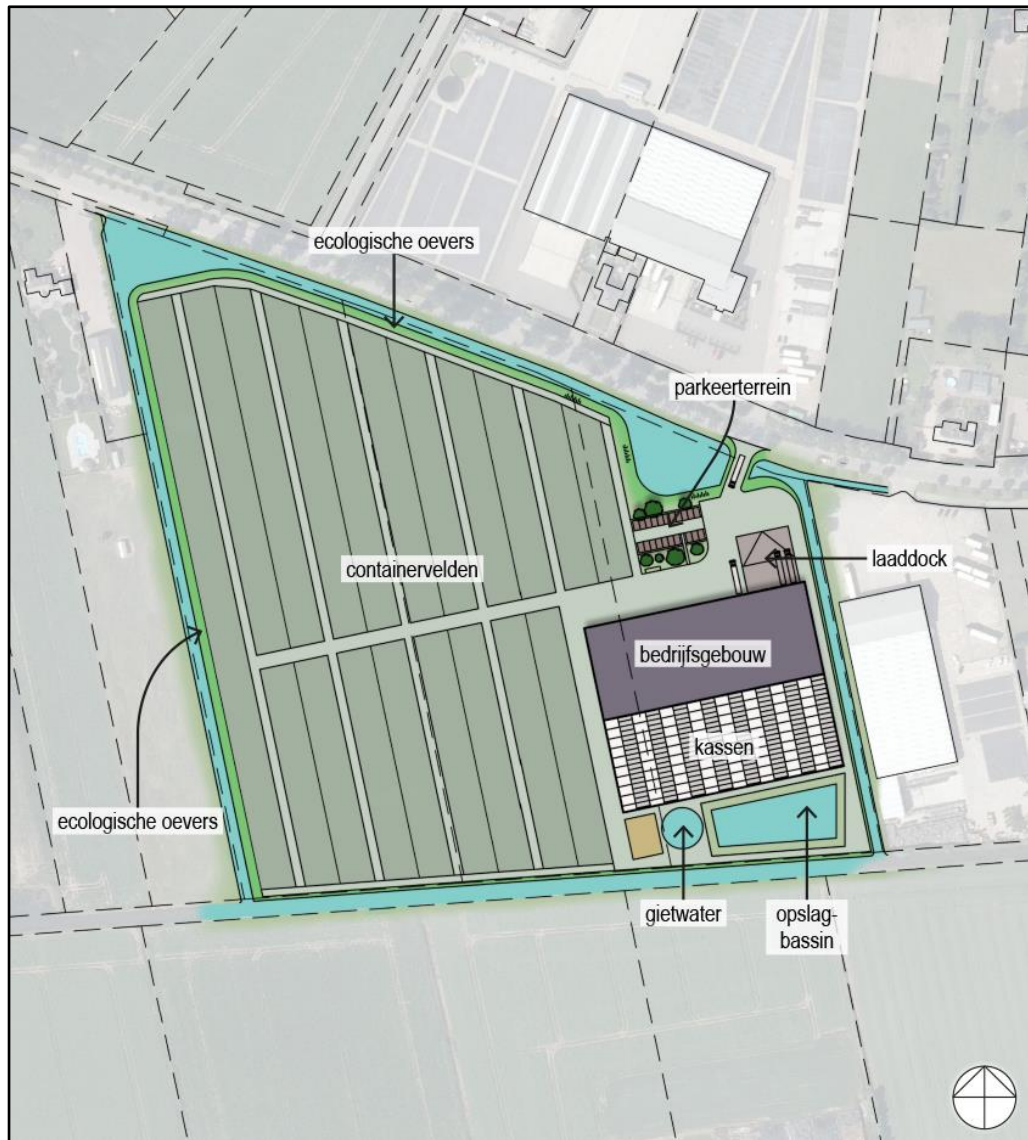
Figuur 3 Visuele representatie van de beoogde situatie.