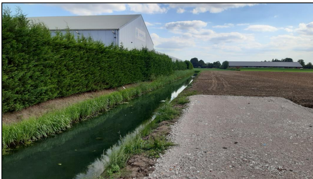
Figuur 2 Waterhoudende kavelsloot op de planlocatie.