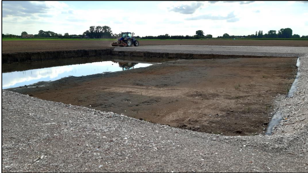
Figuur 2 Fotografische indruk van de planlocatie en de directe omgeving hiervan.