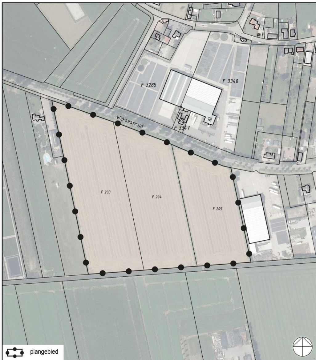
Figuur 1 De planlocatie is gelegen aan de Wijksestraat ong. te Wijk en Aalburg (bron kaartmateriaal: Bureau Verkuijlen).

De directe omgeving van de planlocatie wordt gekenmerkt door plantenkwekerijen en agrarische percelen. Op een afstand van circa 1,5 km ligt de Afgedamde Maas en op circa 3 km de Maas welke fungeren als barrière voor grondgebonden fauna. Op circa 4,3 km ligt natuurgebied Pompveld.