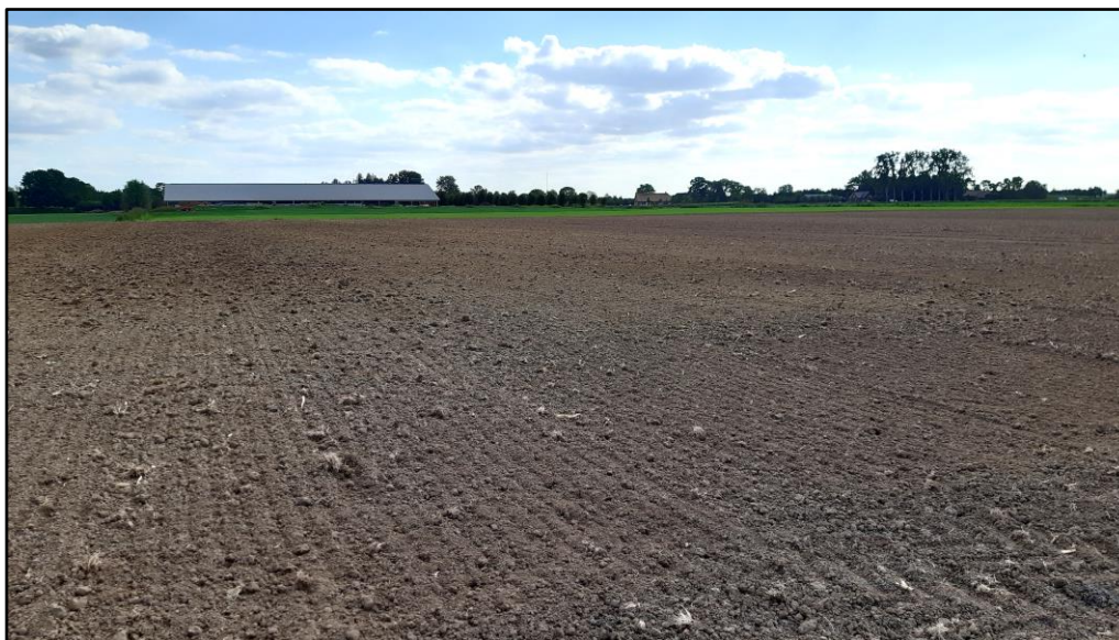
Figuur 1 De planlocatie is gelegen aan de Wijksestraat te Wijk en Aalburg en bestaat uit een agrarisch perceel.