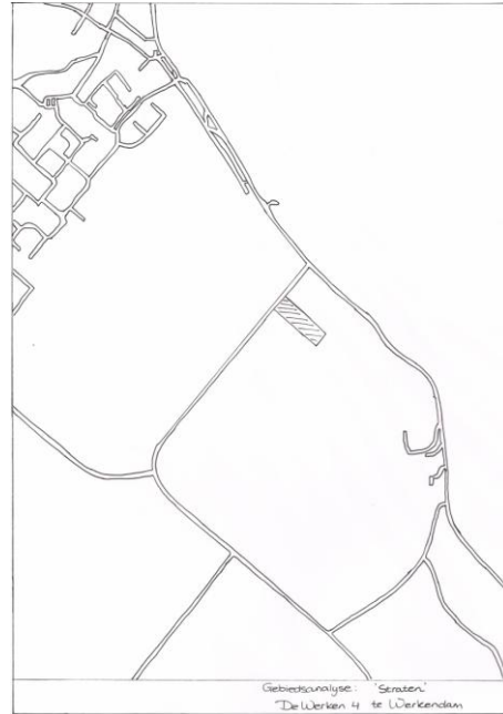
Infrastructuur verharde wegen