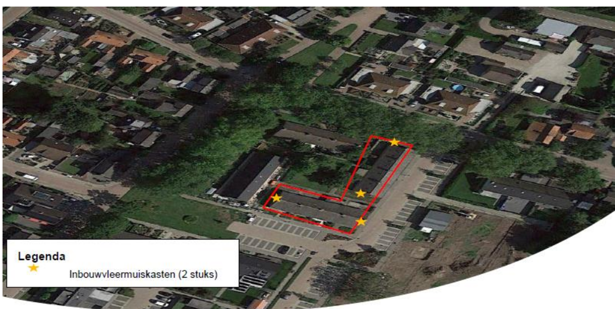
Figuur 3. Locatie van de permanente voorzieningen.