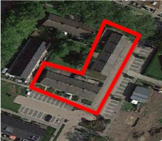
Figuur 1. Locatie Koolmeespadaan 1-7 en de Dokter Esseveldlaan 29-37 te Andel. De activiteiten vinden plaats binnen het omliggende gebied.