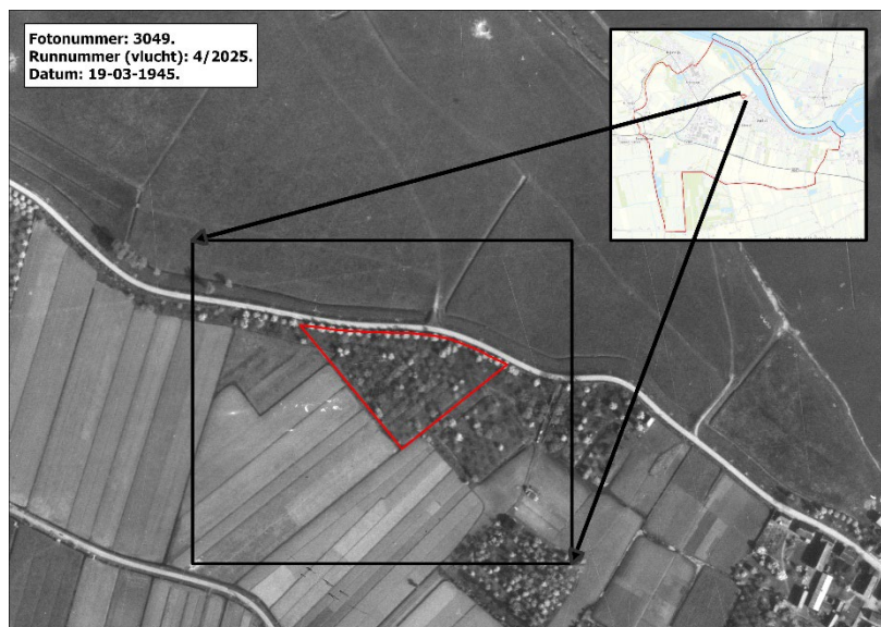
Figuur 3: Uitsnede van luchtfoto m.b.t. contouren van het onderzoeksgebied

- Tenslotte heeft er aansluitend op het nagelopen onderzoek behorend tot 'Mijlpaal 3' een luchtfotoanalyse plaatsgevonden. Hiervoor heeft Bodac B.V. een inventarisatie uitgevoerd van beschikbare luchtfoto's in nationale en internationale archieven. Er zijn geschikte foto's gevonden binnen de collecties van de afdeling Speciale Collecties, Bibliotheek Wageningen University (WUR) te Wageningen. Het betreffen twee foto's van 19 maart 1945 en 16 april van datzelfde jaar; helaas waren er geen foto's beschikbaar na de bevrijding en het officiële einde van de gevechtshandelingen. Bij Figuur 3 is een uitsnede van de meest recente luchtfoto (16-04-1945) m.b.t. de contouren van het onderzochte perceel te zien. Concluderend zijn er, aansluitend op de vorige onderzoekslagen, geen indicaties gevonden die leiden tot een verdachtmaking van een deel of het gehele perceel. Zo zijn er geen kraters van afwerp- en geschutmunitie te ontwaren, net als sporen van geschutstellingen, loopgraven, tankgrachten, etc. Het betrof, vermoedelijk, een bosperceel.