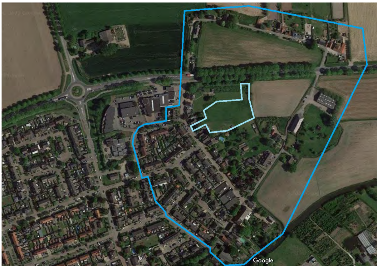
Afbeelding 2: Bezorggebied uitnodiging inloopavond (blauw omkaderd).

Met een persbericht in de huis-aan-huis-bladen "Altena Nieuws" en "Het Kontakt" (ook website) zijn andere geïnteresseerden op de hoogte gebracht van de inloopavond. Daarnaast heeft de Dorpsraad Almkerk op ons verzoek een bericht op hun facebook-pagina geplaatst.