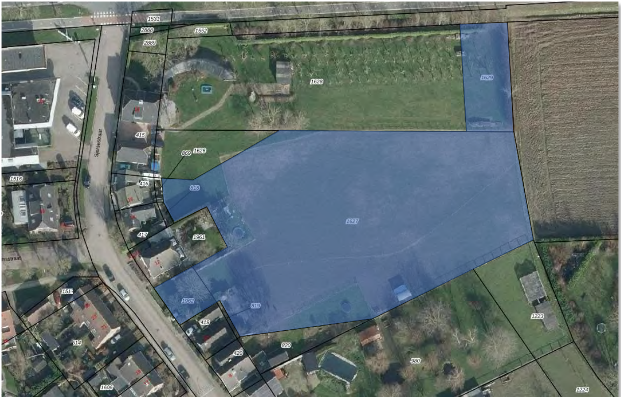
Afbeelding 1: Overzicht projectlocatie (blauw gearceerd).

Sellenra Vastgoed Ontwikkeling BV is voornemens om op het perceel aan de Sjersestraat (zie afbeelding 1 voor de begrenzing van de projectlocatie) een woningbouwontwikkeling te realiseren. Voor dit plan – inmiddels bekend onder de projectnaam Stuwsche Hoeve – is op 12 september 2022 in het kader van de omgevingsdialoog een inloopavond georganiseerd. In dit document wordt verslag gedaan van deze avond. Dit verslag maakt onderdeel uit van de benodigde ruimtelijke procedure, waarbij de resultaten van de gevoerde omgevingsdialoog mee worden genomen in de besluitvorming.