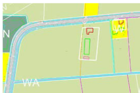
afbeelding 3: bestaande situatie