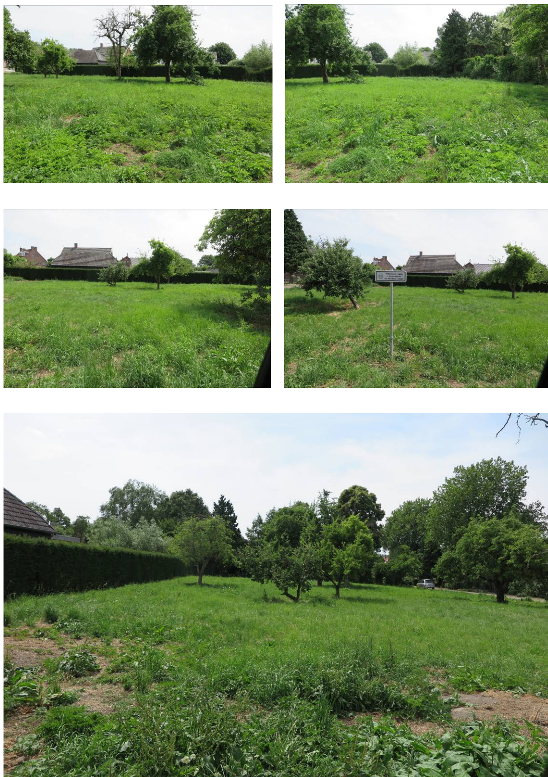
Figuur 2. Foto-impresie van het plangebied Hoek Hogelandstraat te Giessen.