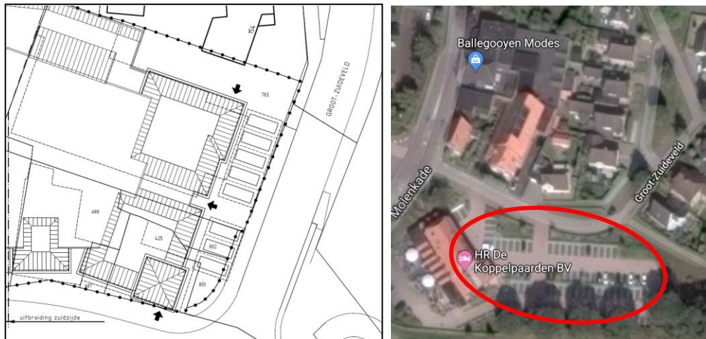
Figuur 2: Links: Uitsnede bouwplan 2018 met 8 parkeerplaatsen aan het Groot-Zijdeveld t.b.v de appartementen. Rechts: Recent uitgebreide parkeerplaats bij De Koppelpaarden met mogelijkheid tot dubbelgebruik.

Voor het plan zal rekening worden gehouden met dubbelgebruik. De parkeerplaatsen bij De Koppelpaarden worden op een ander tijdstip gebruikt als voor Ballegooyen Modes en het kantoor.