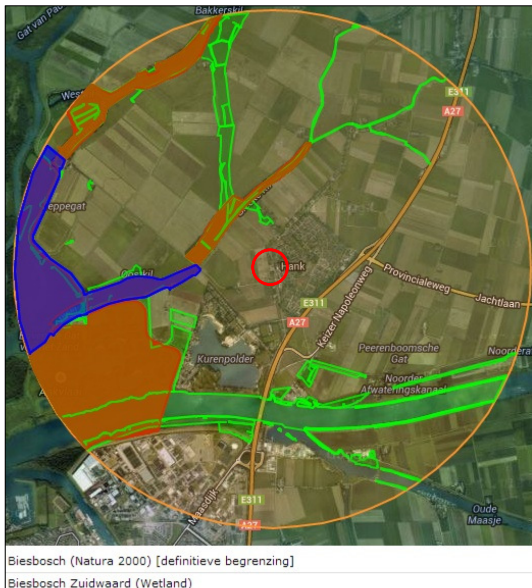
Figuur 2 Hank en omgeving met relevante natuurgebieden.

In onderstaande figuur is het deel van de gemeente Werkendam nabij de onderzoekslocatie met haar ecologisch waardevolle gebieden (in een straal van 3 kilometer) in groene (EHS), blauwe (wetlands) en rode (Natura 2000) highlights weergegeven.