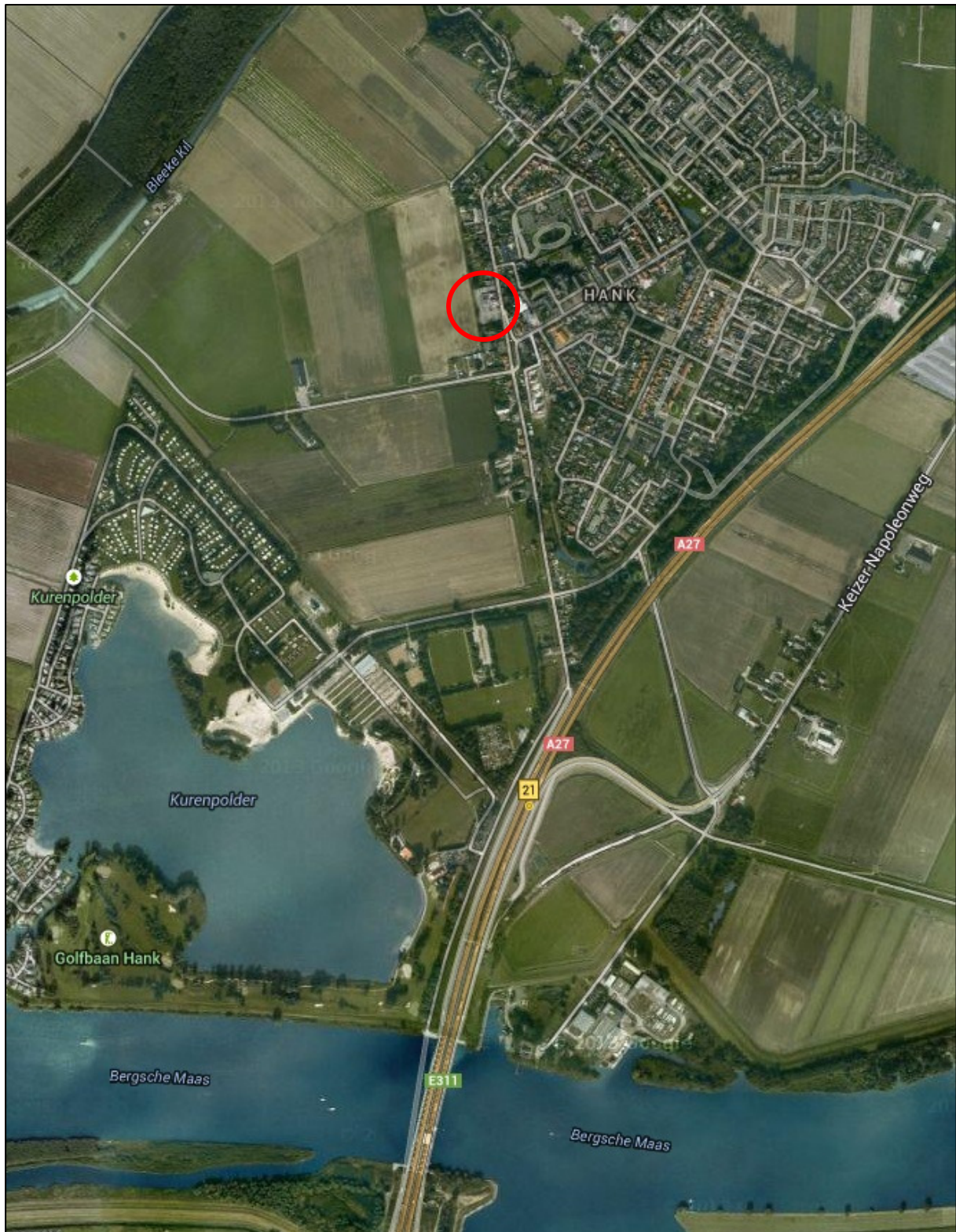
Figuur 1 Luchtfoto van de omgeving van het plangebied.