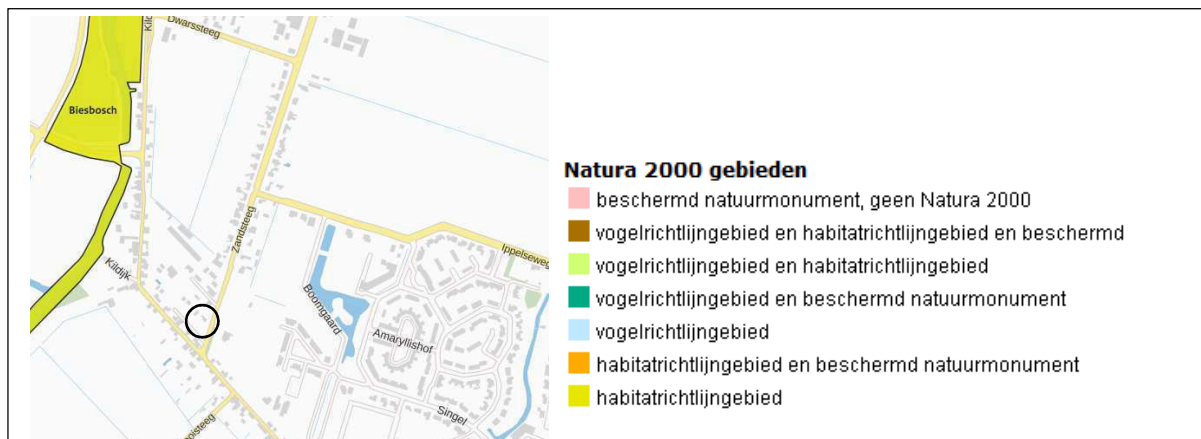
Ligging van Natura 2000-gebied nabij het plangebied. De ligging van het plangebied wordt met de cirkel aangeduid, het Natura2000-gebied wordt met de kleur aangeduid.

Het plangebied ligt op minimaal 273 meter afstand van Natura2000-gebied. Op onderstaande afbeelding wordt de ligging van Natura2000-gebied in de omgeving van het plangebied weergegeven. De ligging van het plangebied wordt met de cirkel aangeduid.